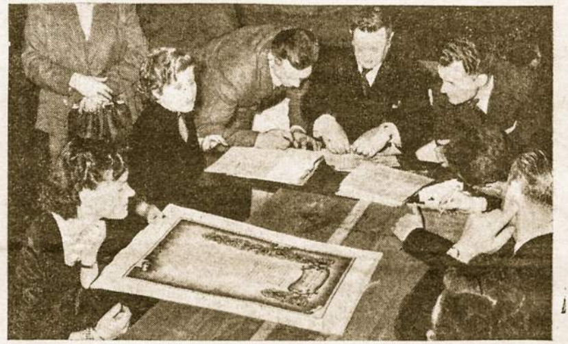
Pasirašomas Liet. Prek. ir Pram. S-gos steigimo aktas Lietuvių Salėje š. m. liepos 30 d.