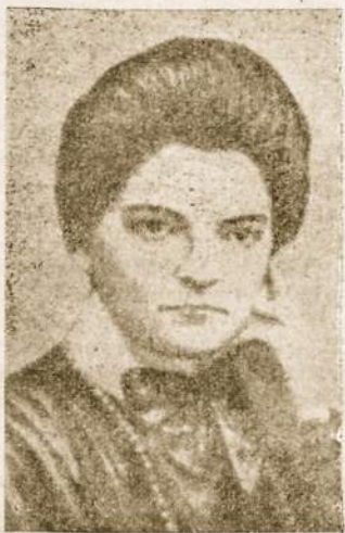
Rašytoja Marija Pečkauskaitė - Satrijos Ragana

Satrijos Raganos raštų žanras yra apsakos, novelės ir dienoraščiai. Kai kuriuose veikaluose randame daug autobiografinių bruožų, ypač dienoraščiuose. Kadangi Satrijos Ragana tikra to žodžio prasme yra rašytoja ir auklėtoja, todėl bus aiš-