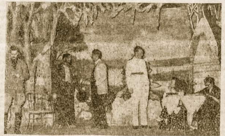
Scena iš Lietuvių Salėje liet. jaunimo suvaidintos dramos „Valkata“.