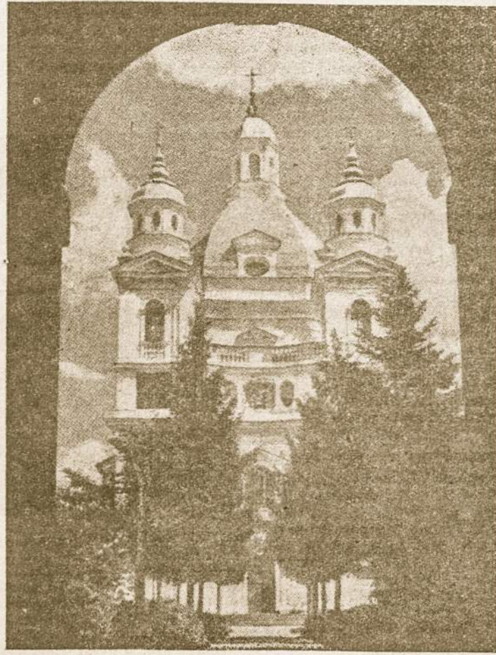
Pažaislio Dievo Motinos šventovė.

mimo į vieną žydų sektą drausmę. ir kitas — kovą tarp šviesos ir tamsos vaikų, abu yra nežinomo autorius. Likusieji trys ritiniai, — iš viso jų buvo septyni — aiškina Lameko apreiškimą, talpina šlovės ir