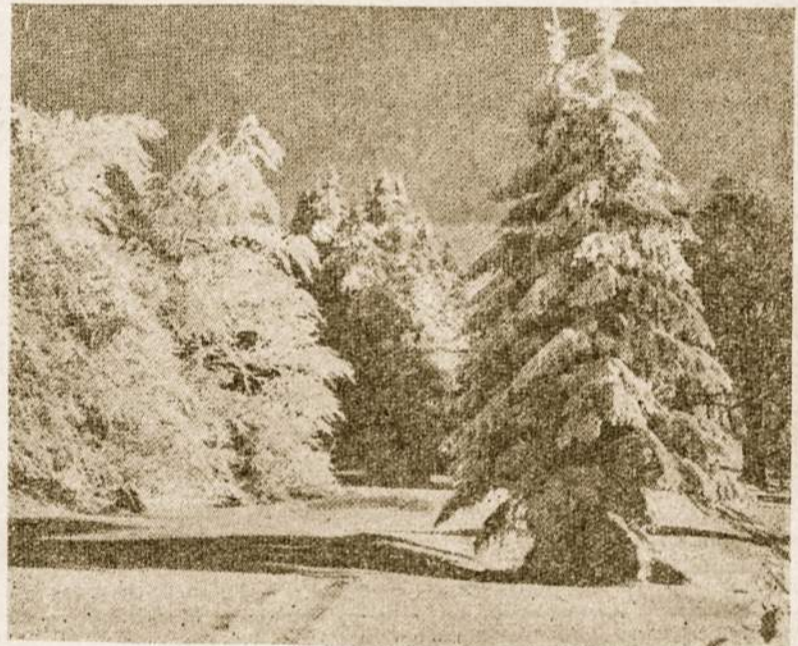
Taip pasipuošusi laukia Kalėdų mūsų Tėvynė.

Vyras gali ištiesą dieną pratupėti pakrantėje žiūrėdamas į meškerės galą, bet jis nervuojasi ir priekaita, jei moteris pavėluoja dešimtį minučių su pietumis?