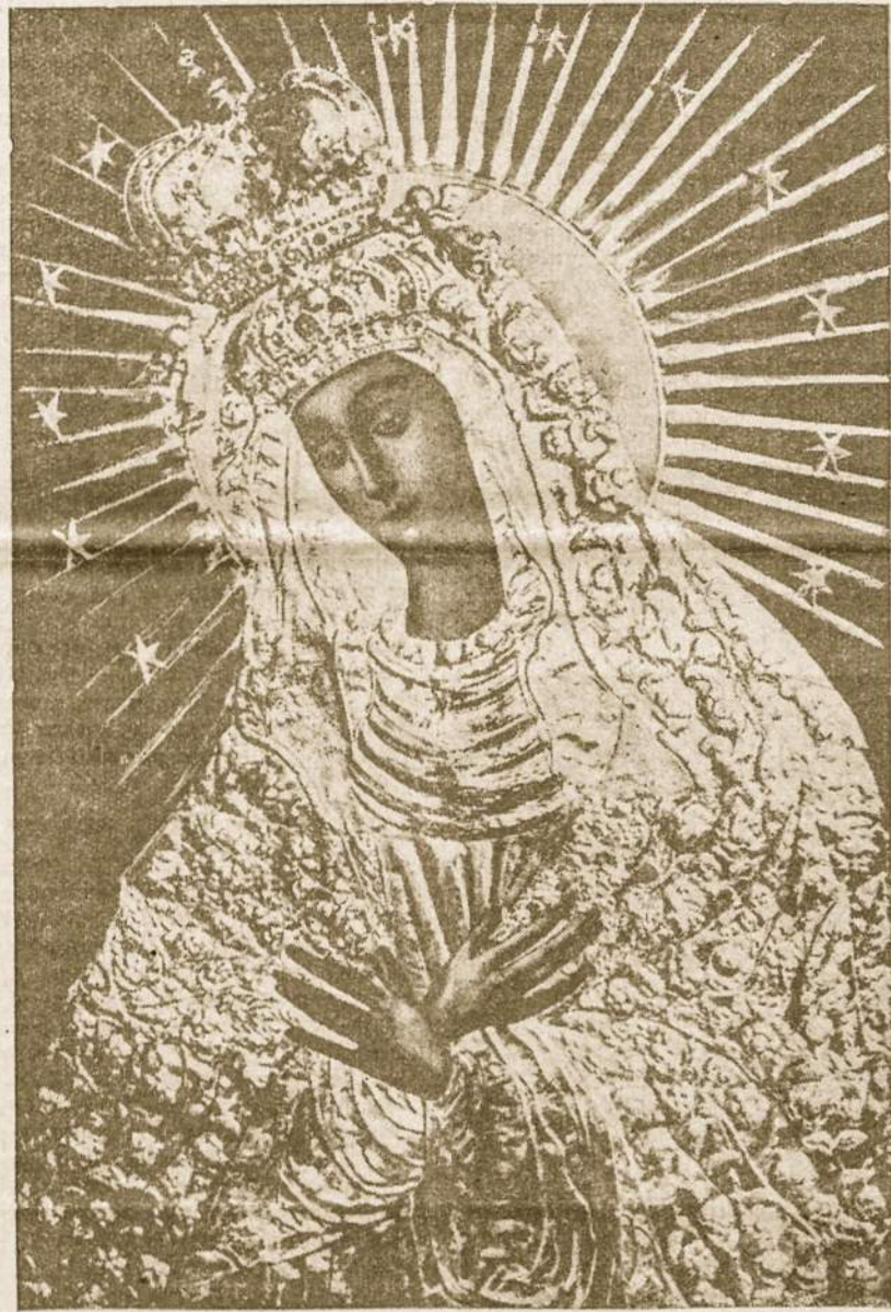
Aušros Vartų Marija, sugrąžinkite pavergtai Lietuvai laisvės dienas!

....Ne vienas Popiežius, kaip ir Lietuvoj lankęsis Pijus XI, mūsų žemę yra pavadinęs Terra Mariana — Marijos Žemė. Kodėl? Pati krikščionybės pradžia Lietuvoje yra paženklinta Marijos garbės ženklais. Vytautas Didysis, kurs Lietuvą pakrikštijo, pats pirmasis pasidarė