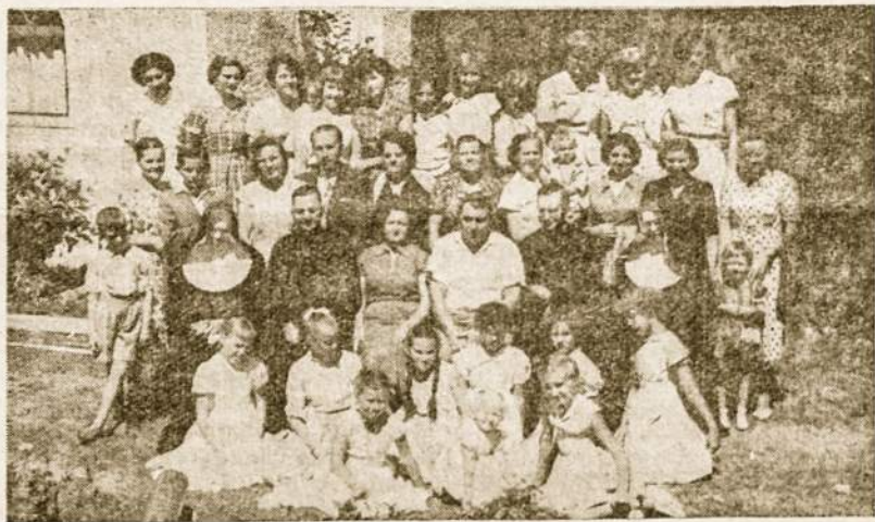
Stovyklaujančios mergaitės TT. Marijonų viloje — Kordoboje su vadovais, fundatoriais ir svečiais po lietuviškų pamaldų.

Žudomai tautai reikia kurti brangiausią vertybę — žmogų. Šiais didžiųjų pavojų laikais, kai tautai pastatytos kartuvės, mums reikia žmonių, tobulų ir pilnutinių, žmonių jaunų siela, sveiku protu ir skaisčia sąžine, o ne invalidų, ne lavonų, ne kapinynų ir antkapių. Juk ne lavonais ir ne kapinynais atkursime laisvąją Lietuvą. Tik tobulus žmogus, pasirėmęs Kristumi, atlaikys ir užaujančias audras, ir pasiliks savo Tėvynei ištikimas ir