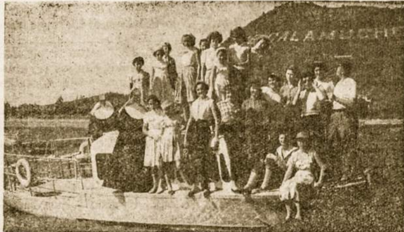
Smagu stovyklaujančioms plaukti Calamuchito ežere su lažiu laiveliu.

Politiškai tokios fanazijos ruošia dirvą tarp lietuvių ir gudų tautų nesantaikai bei kovoms, kas lietuviams visai nepageidautina, nes mes norime geriausių santykių su visais kaimynais, o patiems gudams gali padaryti didesnės žalos, negu