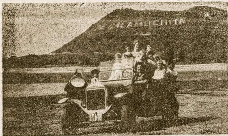
Sausio 15 d. atostogaujančių mergaičių grupė Villa del Diqueje „modernišku“ automobiliu grįžta po ekskursijos laivelius.

deda dainuoti lietuviškas dainas taip žavingai, kad sudomina net argentiniečius. Jie greitai išmoksta „tra, lia, lia, lia...“ ir visas autobuses skamba lietuviška daina. Norėjosi miego, bet argentiniečiai šaukė, kad dainuotume toliau; mat jiems patiko mūsų linksmos melodijos.