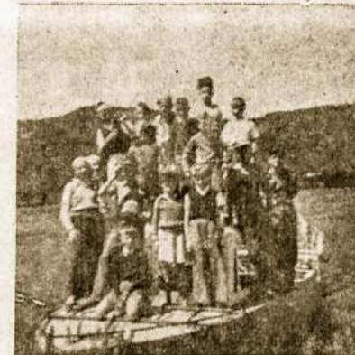
Ir mes plaukėme su laiveliu per Calamuchita ežerą...