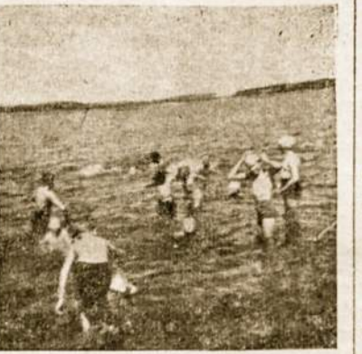
Smagu stovyklaujantiems berniukams maudytis Calamuchita ežere.