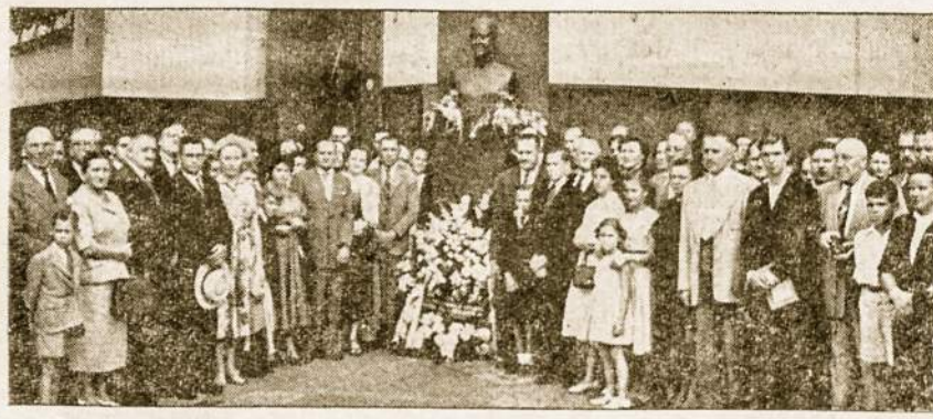
Vasario 16-tos proga, LICA su visomis kitomis lietuviškomis organizacijomis, gausiai dalyvaujant patriotinei visuomenei, padėjo vainikus prie San Martin mauzolėjaus ir Evitos biusto.

Vasario 16 d. specialią programą, skirtą Lietuvos nepriklausomybės 37 m. sukakčiai atžymėti, davė taip