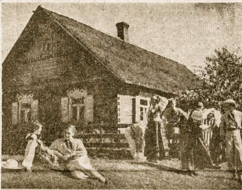
Linksmas pavasaris Lietuvos kaime...

prisidės prie taikos sudarymo". Žinome gerai, kad Austrija, prievarta prijungta prie Vokietijos 1938 m., ligšiol dar neturi taikos sutarties, tebėra okupuota, ir dalis jos teritorijos yra Maskvos okupantų prievartaujama ir apiplėšiama. Anksčiau minėti Raab žodžiai yra panašūs į avinėlio pasiteisinimą, gi Maskvos atsakymas, be abejonės, turės būti pasa-