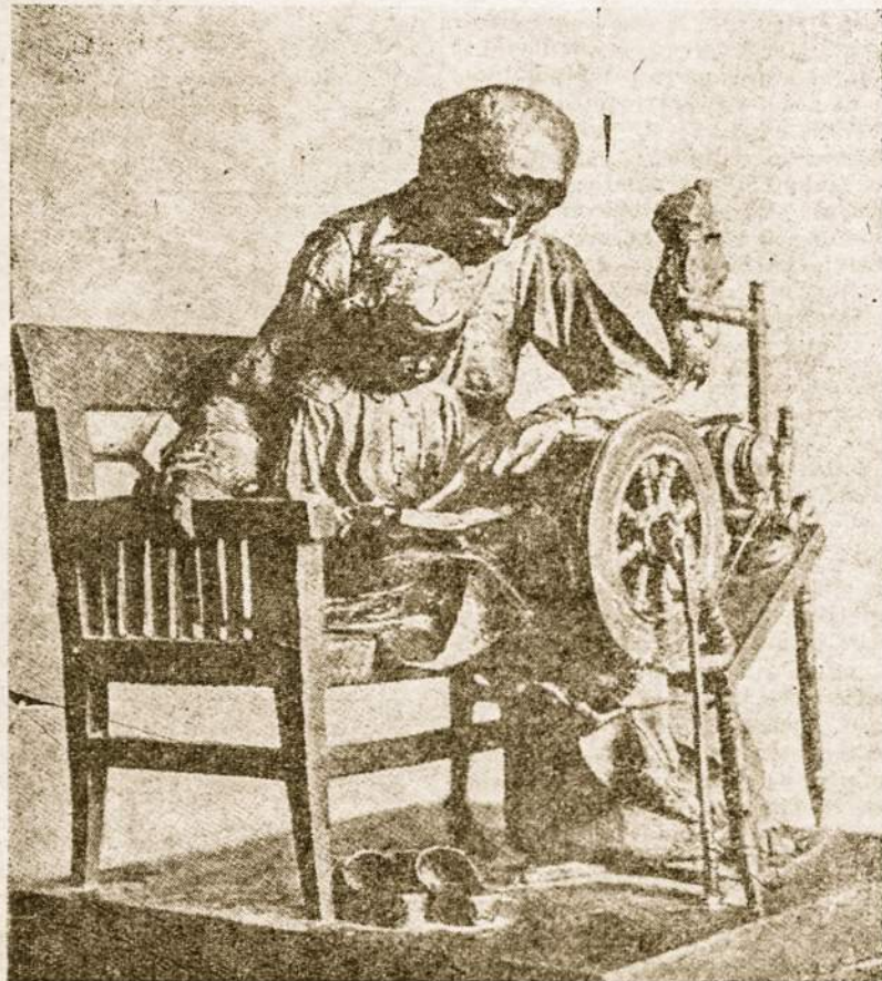
Lietuvė motina prie ratelio išmokė sūnų ir dukrą eiti šviesos keltu.

biausia, atrodo, kad mokslinės tiesos net prieštarauja religinėms tiesoms. Ir šicia yra klystama. Juo žmogus daugiau gilinasi į studijas ir juo daugiau praplečia savo akiratį įvairiais moksliniais klausimais, juo jis daugiau pradeda ir, pasakyčiau, sugeba suprasti, kad jo žinojimas yra labai menkas ir netobulas, nes jisai pats yra tikrai labai menka dalis tos nepaprastai Tikslingos Kūrybos — Slė-