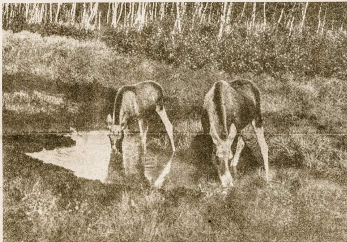
Neringa. Briedžio patelė su vaiku.

Bendrai, visa dabartinė politika yra laukimo tarpsny, nes būsimoji „keturių didžiųjų“ konferencija turėtų atnešti šį tą naujo. Bet kas gali ir subega,