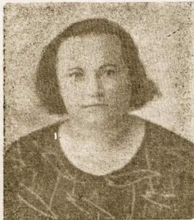
Kviečia visus gimines ir pažįstamus jose dalyvauti