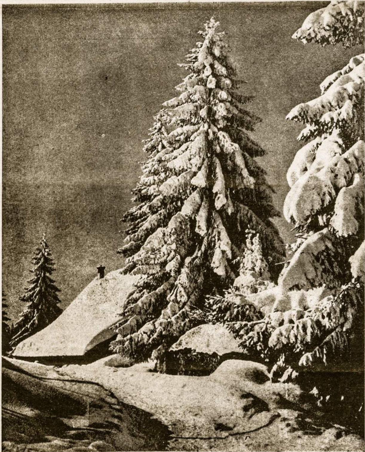
TOKIA ŽIEMA BŪDAVO MŪSŲ TEVYNEJE LIETUVOJE