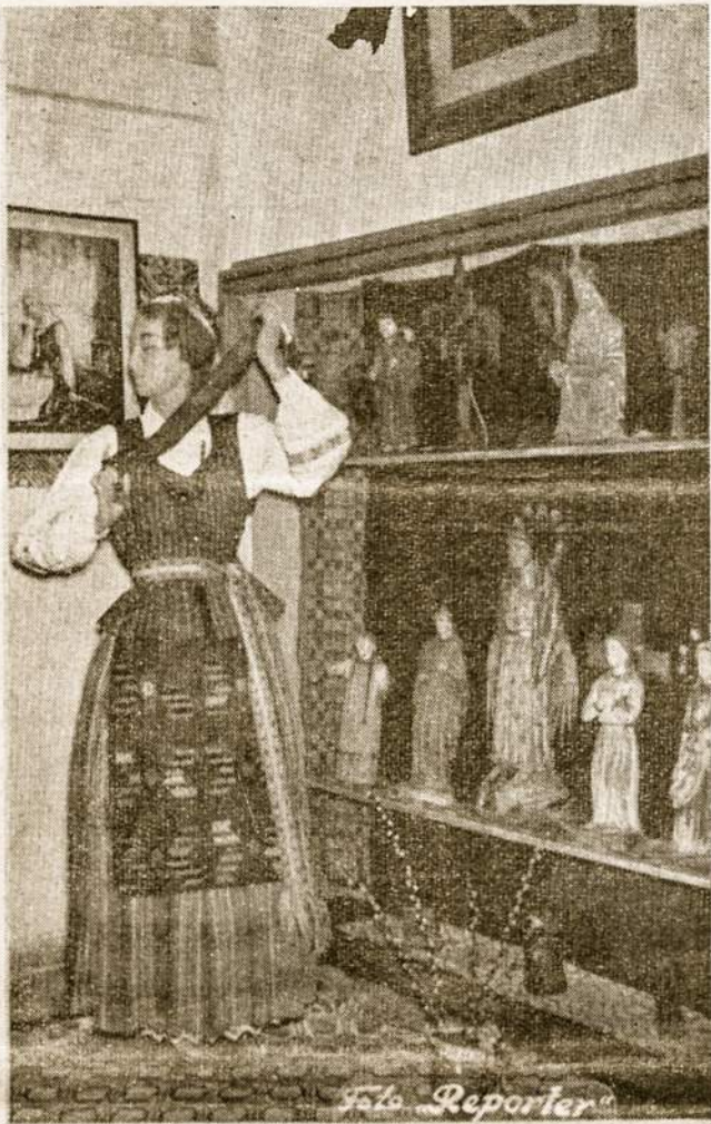
Lietuvaitė tautifiuose rūbuose prie lietuviškų smūtkelių Lietuvių Kolonijos Tautiniame Muziejuje.

— Tikrai, Valdyboj numatyti 7 nariai. Tam septintajam skiriama taip pat labai svarbi sritis. Štai nuolat skundžiamasi, kad kultūri-