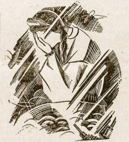
BRANGI DOVANA IS SIBIRO DARBO VERGŲ STOVYKLOS

Gauta Hetuvio dvasininko pašventinta stula, pasiūta į Vakarus. Stula buvo panaudota laikant slapta pamaldas. Ji tuo tarpu yra Vilke. Vėliau ją su tam tikromis iškilėmis norima su Vokietijos katalikų bažnytinės vyresnybės žinia perduoti šv. Tėvui. Stula yra nufotografuota baltai — juodai ir spalvotai. Nepaisant sunkiausių gyvenimo sąlygų ir medžiagų trūkumo, darbas išsiuvinėjant stulą, atliktas vienoj tolimoj Sibiro darbo vergų stovykloje laikomų lietuvių labai stropiai. Tačiau ją išsiuvinėti mūsų tautietės turėjo slaptai, kad nepastebėtų MVD agentai.