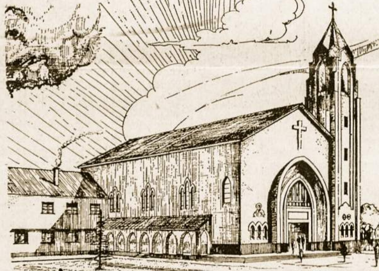
Rosario lietuvių šv. Kazimiero bažnyčia ir vienuolynas.