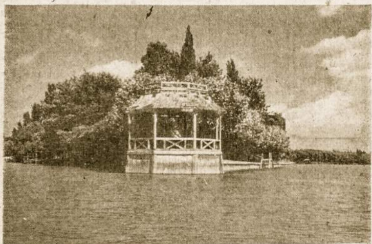
Sarmiento ir San Antonio upių santaka.