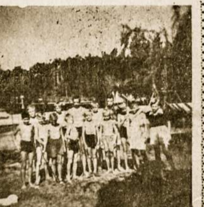
Stovyklaujantis jaunimas mandosi Calamuchito ežere, plaukioja laiveliais, žaidžia, linksminasi ir džiaugiasi teikiama malonumais, beto išmoksta tėvų kalbą.