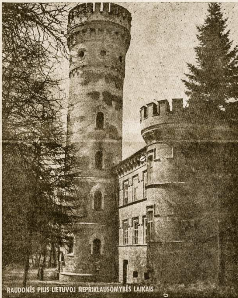
RAUDONĖS PILIS LIETUVOJ NEPRIKLAIMOMYBĖS LAIKAIS