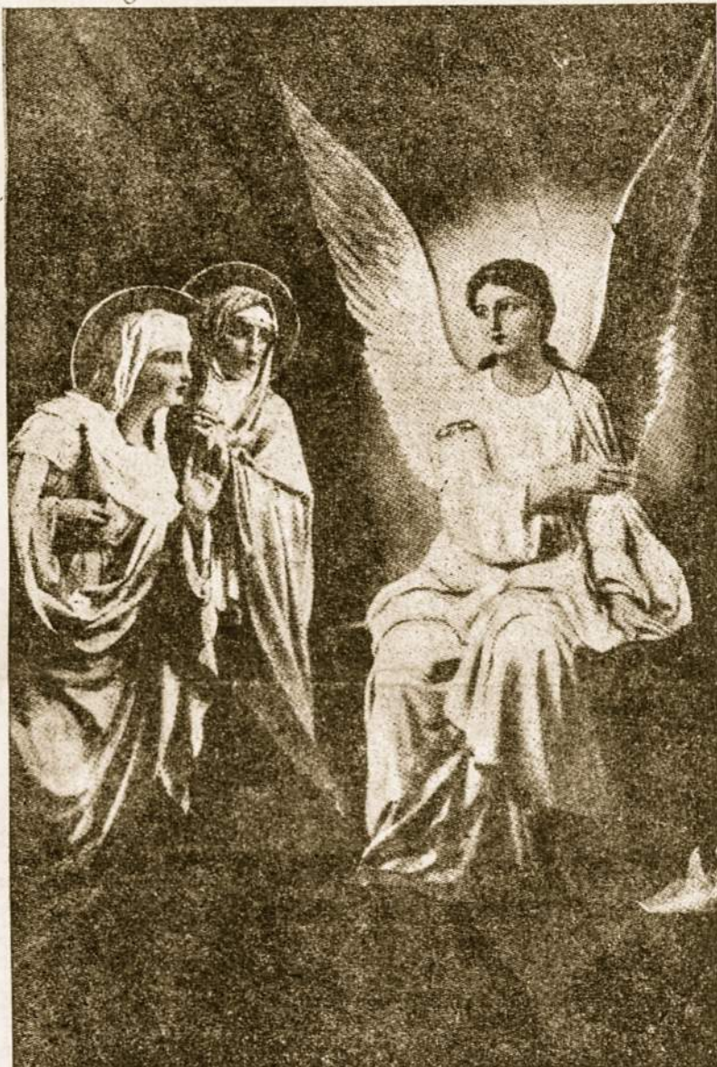
Kristus kėlės — kelsimės ir mes!

Maskvos raudonųjų lankymasis sustiprins Anglijos tarptautinę padėtį. Artimųjų Rytų srityje Anglija pamažu išstumiama JAV valstybių. Be abejonės, Anglijos kolonijinė politi-