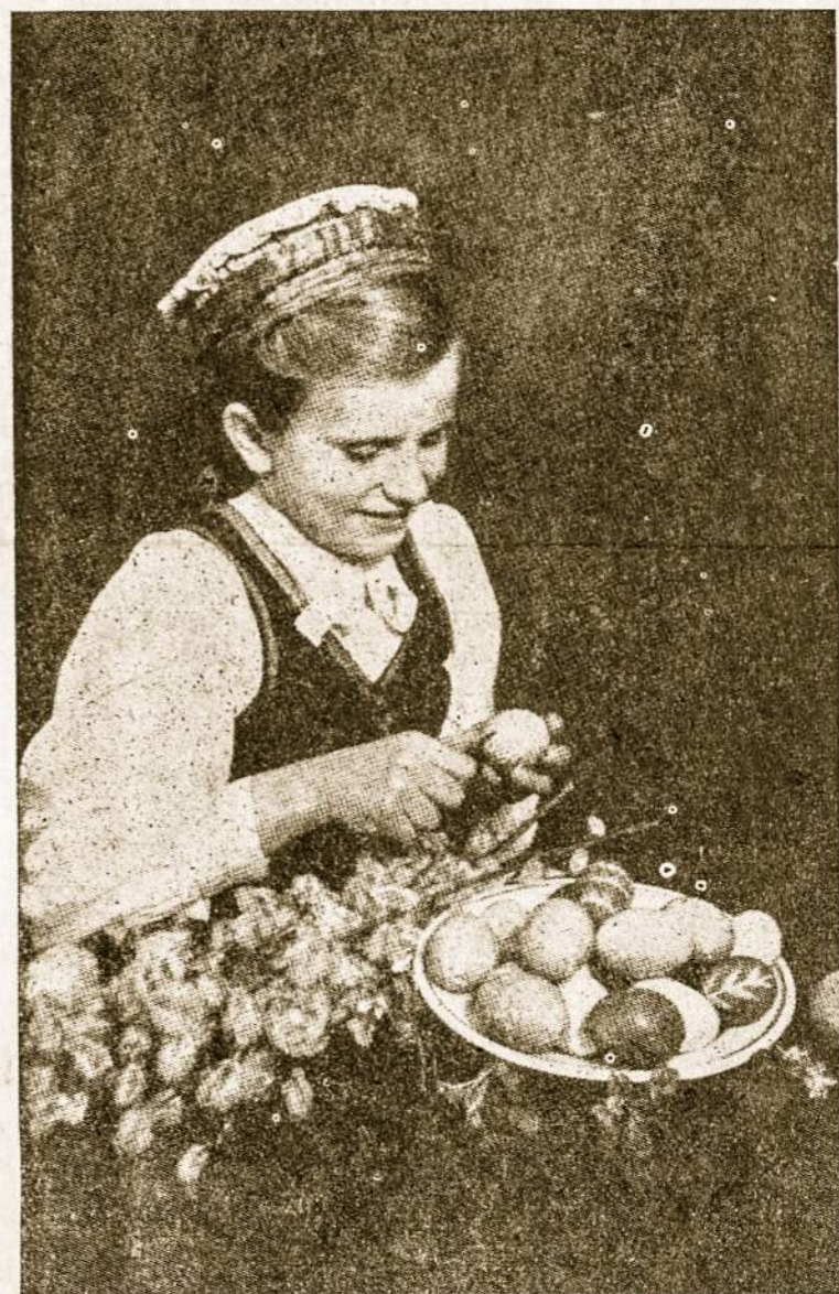
Šmarginsiu margučius gražiau, nei Velykų kiškėlis.

→ Vasario 16 d. gimnazijoje, kuriai Vasario 16 d. suėjo 5 metai, šiemet egzaminus laiko 9 abiturientai. Vasario 16-sios gimnazija didelis susidomėjimas parodytas ir per Nepriklausomybės šventės minėjimus visame laisvajame pasaulyje.