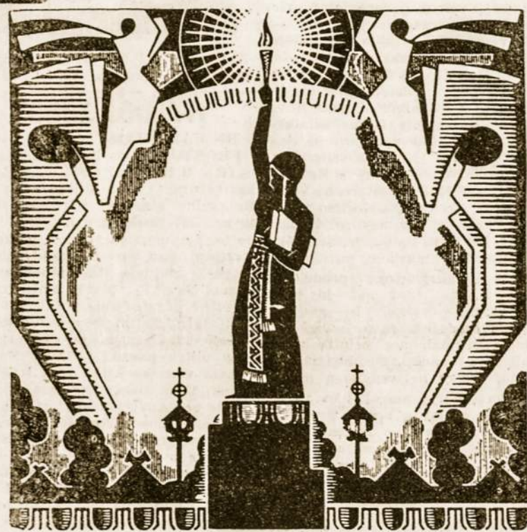
Išėivijos jaunime, siek augštų idealų!