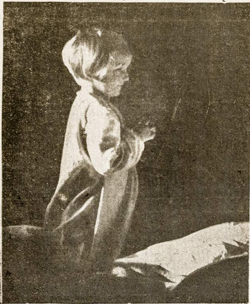
Nekalto kūdikių rytinė malda.

Ir dar tie nelaimingieji 20 milijonų, kurie buvo šaltakraujiškai likviduoti. Ukrainoje dirbtino didžiojo bado laikais.