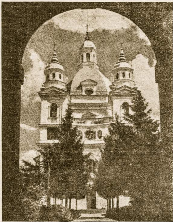
Stebuklingoji Pažaislio Dievo Motinos šventovė

Tačiau neužtenka, kad šie dieviškosios šviesos spinduliai mirgėtų kažkur toli už debesų, nepermatomoje tolumoje. Jie turi nušviesti mūsų kasdieninį realųjį gyvenimą. Mėlynoji Arminija, šią dieviškąją šviesą sklindančią iš Fatimos ir mūsų dienų tamsą, stengiasi malda, atgaila ir pasiaukojimu įauti į mūsų kasdieninį gyvenimą ir išplėsti ją visoje mūsų tautoje. Amžinosios šviesos spinduliai, nušviečiantieji žmonių ir tautų gyvenimą, nėra svajonė ar iliuzija, tačiau jie vaisių duoda tik tada, kai nepailstamu darbu ir auka apvairnikuoja visą mūsų gyvenimą.