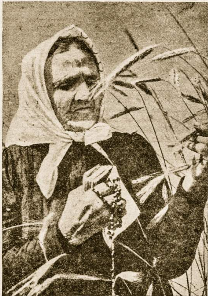
Tu mano, motinėle, močiute sengalvėle...

Kongreso darbu metu buvo parodyta daug simpatijų lietuviams. Įdomus faktas, kad Kongrese iš pavergtųjų kraštų tedalyvavo tik lietuvaitės ir rusės: pavergtos ir pavergėjos, bet lygios visos toje pačioje nelaimėje. Lietuvaitės gražiai pasirodė žibintų procesijoje ir folkloriniame tautų vakare. Visa Italijos spauda tai pažymėjo. Austrės atstovės pareiškė, kad jos nuolat