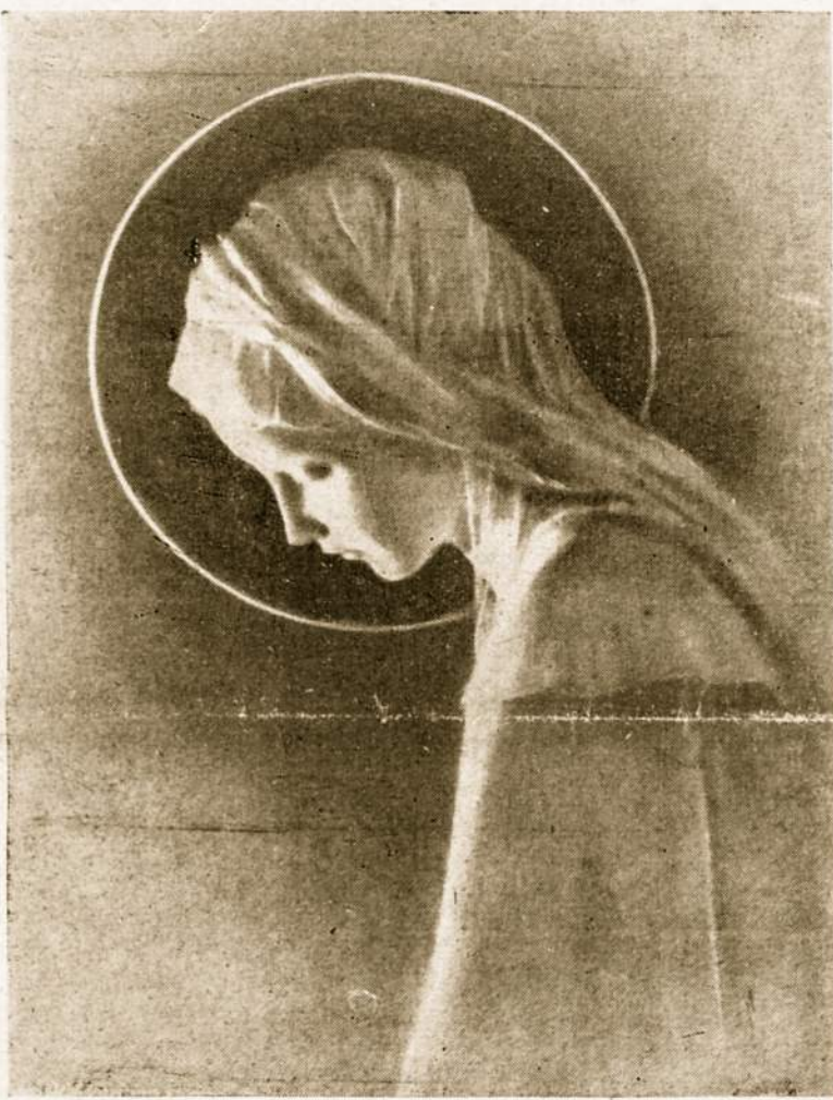
Rože Paslaptingoji, melskis už Lietuvą!

sios pramonės mašinas ir kariuomenės reikšmės medžiagas bei žaliavas. Ypatingai reikia pabrėžti, kad šioje srityje skyrėsi JAV ir Anglijos norai. Vasingtono supratimu, prekybiniai santykiai su Rusijos kumštyje esančiais kraštais ir su pačia Maskva neturi būti gerina-