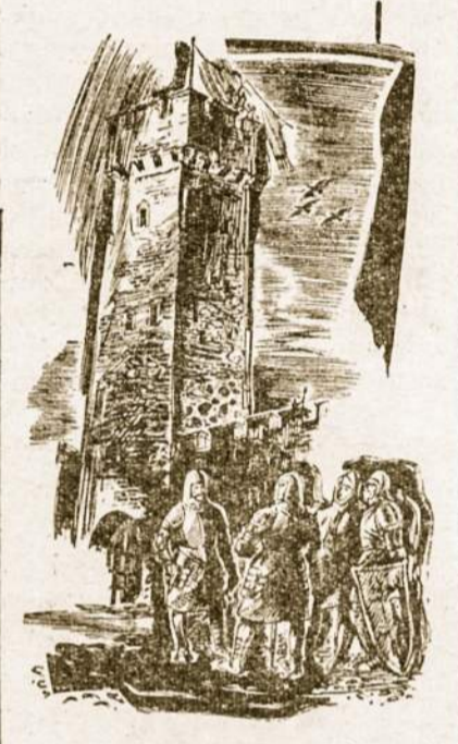
V. K. Jonynas Ilustracija

jos, pradėtos 1939. 8. 23. Stalino - Hitlerio slapto susitarimo pasirašymu. Lietuvių tautai, taip pat ir didžiajai daugumai laisvojo pasaulio valstybių tas „inkorporacijos“ aktas yra niekinis. Tarptautinės teisės požiūriu Lietuva tebėra nepriklausoma suvereninė valstybė, tik jos suverenumo vykdymas savoje teritorijoje dėl sovietų agresijos ir ją sekusios karinės okupacijos yra sukludytas. Jei dabartinė Kremliaus kolektyvinė diktatūra nutartų aną neteisėtą ir niekinį veiksmą anuoluoti, tautai, nors ir tik formaliai, atitaisytų vieną iš didžiųjų Stalino nusikaltimų. Jei Kremlius eventuali tautai darytų, darytų ne Lietuvos nepriklausomybei ir laisvei atstatyti, bet savų interesų labui. Lietuvių tauta ir jos reprezentantai laisvajame pasaulyje nesiliaus kovoję draugėje su visom kitom sovietinės agresijos aukom prieš sovietų imperializmą bei kolonizaciją, kol sovietų pavergtuose kraštuose nebus atstatyta nepriklausomybė bei laisvė.