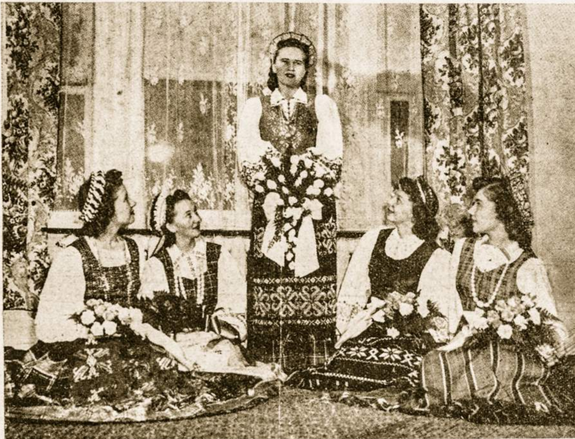
Žavinga vestuvių nuotrauka. Ypatingai įdomi karūnėlė pirmosios iš kairės pamergės.

Jie tiek turės grožio, kiek darbo ir meno juos siuvinėdama, brangi sese, idėsi. Tavo tautinė garbė to reikalauja, kad Tavo nešiojami taut. rūbai būtų tikrai meniški, nes jie liudija netik tavo skonį ir darbštumą, oet yra gyvi mūsų tautinio meno liudininkai svetimųjų tarpe. Taut. rūbus įsigyti yra sunku. Ar nevertėtų organizuoti bent sijosų audimų? Be abejo, yra moterų,