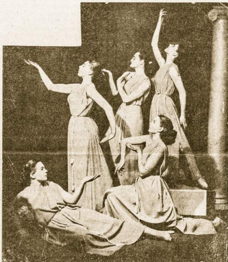
Australijos lietuviškos išraiškos šokys

Mac. Masterio Universiteto socialinio studentų klubo diskusijose apie imigrantų vaiką kanadietis mokytojas pareiškė, kad imigranto vaikas nesudaro jokio sunkumo, nors ir ateina į mokyklą nemokėdamas anglų kalbos, jei jis ateina iš normaliai gyvenančios šeimos. Proble- mą sudaranti motina, kuri ne- sugeba išmokyti vaiką savo kal- bos ir tuo būdu nepadaeda jo as- menybei vystytis. Net emigra- cijos valdininkai pradeda svar- styti, kaip padėti motinai, kuri nesugeba išmokyti vaiko savo kalbos ir mylėti savo kilmės krašto, kad šie sugebėtų mylėti ir naująjį. Šios problemos pa- sunkėja, jei motina dirba, bet