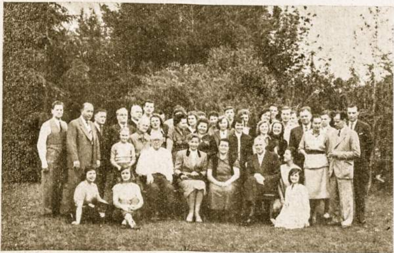
Spalio 7 d. studentų suvažiavimas p.p. Gasevičių vasarvietėje.

Kūnas ir siela, būdami suristi vi- nas su kitu ir vienas nuo kito pri- klausomi, negali dabartinėse sąly- gose, kol yra esminėje vienybėje vienas be kito veikti. Kūnas turi didelės įtakos į protą. Visi medic- nos patyrimai rodo, kad kūno li- gos atsiliepia į protinį veikimą. Jei valgome tai, kad pakenkia virški- nimui, galime būti blogos nuotai- kos visą dieną, ir nežinosime kodėl.