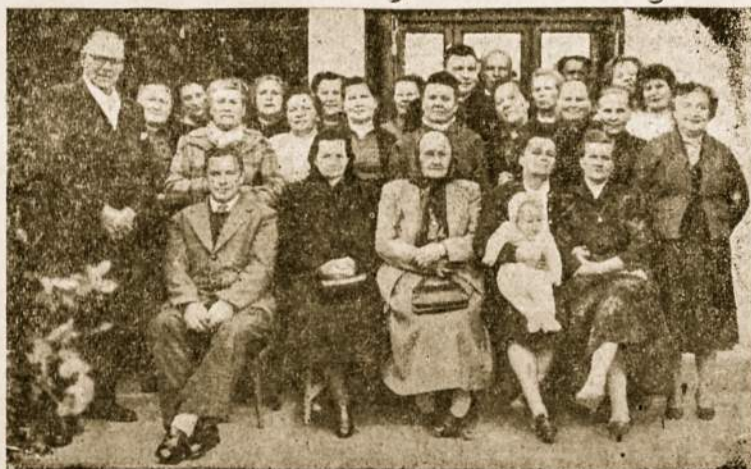
Berisso Gyvojo Rožančiaus Brolija, atšventusi 15 metų sukaktį.