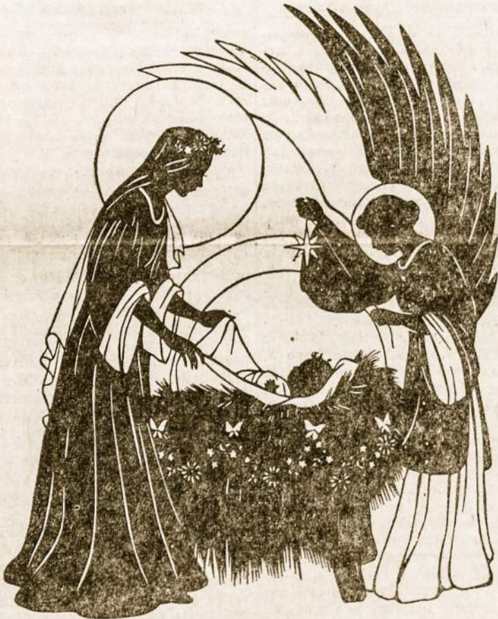
GARBĖ DIEVUI AUKŠTYBĖSE, RAMYBĖ GEROS VALIOS ŽMONĖMS ŽEMĖJE.

Gražūs mūsų papročiai. Bendra malda ir plotkelė sujungia visus šeimos narius. Ramumas ir meilė kiekvienoje doros šeimos pastogė. Tikra šeimos šventė. Suradę meilę, pajusime ir ramybę žemėje, kurią dangus žadėjo visiems geros valios žmonėms.