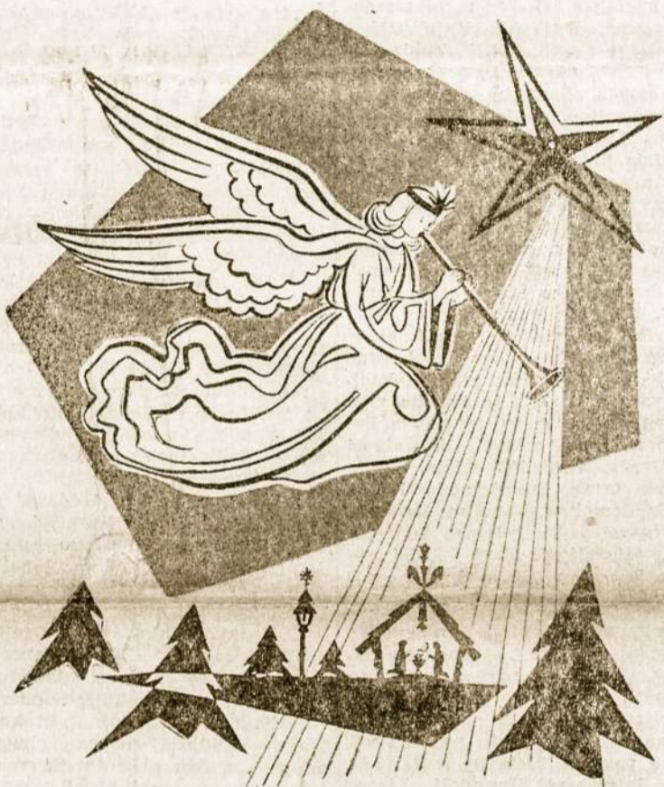
SVEIKI SULAUKĖ SV. KALĖDŲ IR NAUJŲJŲ METŲ!

tas iš tų pareigų, dėl atominės energijos reikalu padaryto pareiškimo, galima buvo spėti, kad šis „personalinis“ pakeitimas yra ženklas, kad Jungtinėse Tautose Vengrijos reikalas lieka kaip žiauri, daugelį sukretusi istorinė pamoka ir kad reikia laukti slaptos diplomatinės veiklos pagyvėjimo, blokuose stengiantis prieiti prie tam tik-