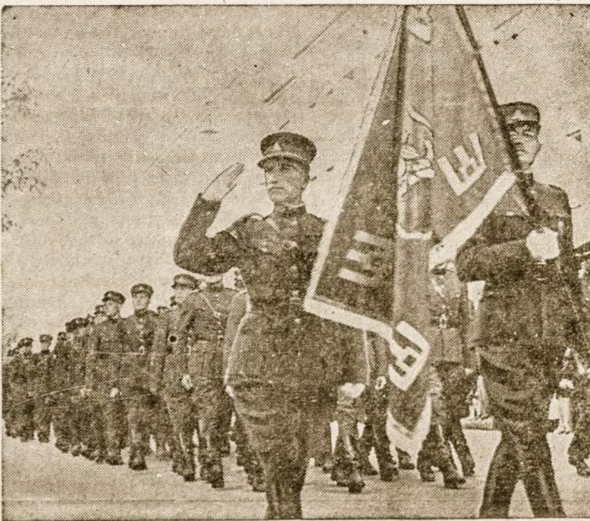
Laisvos Lietuvos kariuomenė. Ne vienas iš mūsų buvome jos eilėse...

Jau ankstyvesniuose „Laiko“ numeruose buvo minimi Kremliaus voratinklių mezgimo būdai ir priemonės. Šių „raudonųjų“ voratinklių apraizgotas Naseris kiek galėdamas bando narpliotis, nes karinis anglių - prancūzų įsikišimas, atrodo, kiek įbauginęs Maskvos „vorus“, tuo tarpu remiamas iš Kremliaus tik moraliai. Tačiau gerai žinome, kad kraugeriškas „raudonųjų carų“ užmačias negalima sutramdyti gražiais žodžiais, — jų veiklos pasėkos jau ima reikštis gana ryškiais bolševikinėmis formomis Sirijoje. Jau spaudoje galima užtikti žinučių, jog Siriją galima esą laikyti nauja, gal kiek dar ir užmaskuota, satelitine Maskvos valstybe. Iš kitos gi pusės yra gražių