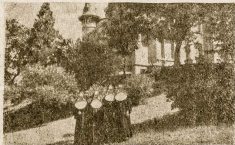
Šv. Kazimiero Seselių vienuolija šiais metais švenčia savo gyvavimo 50-ties metų sukaktį. Čia matosi Argentinos lietuvių kolonijoje besidarbujančios Seselės Kazimierietės.

nepriklausomybės atstatymą. Ir tai padarė tada, kai dar ne tik Vilniuje, bet ir visame mūsų krašte šeiminkavo vokiečiai. Rusijos galybė buvo palaužta. Vokiečių divizijos grįžo iš rytų namo, trypdamos Lietuvos žemę ir slopindamos tautinį atgimimą. Tačiau lietuvių ryžtas buvo stipresnis už priešų jėgą, tėvynės meilė buvo karštesnė už karo mašinos ugnį. Pajudėjo savonorių pulkai; kovos tęsėsi dar keletą metų, kad gyvybės kaina būtų įamžinta tai, kas Vasario 16 akto paskelbta. Ir Lietuva tapo nepriklausoma. Mūsų Nepriklausomybė šiandien yra paraližuota, bet nemirusi: ji gyva pavergtųjų ir laisvųjų brolių bei sesių širdyse; ji gyva ir laisvojo pasaulio sąmonėje. Lietuva kelsis iš naujo