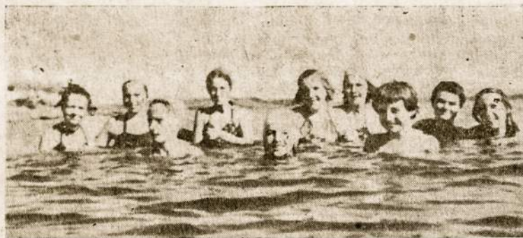
Atostogautojos plaukioja Calamuchito ežere. Linksmi, kai saulutė skaisčiai šviečia ir vanduo nešaltas!