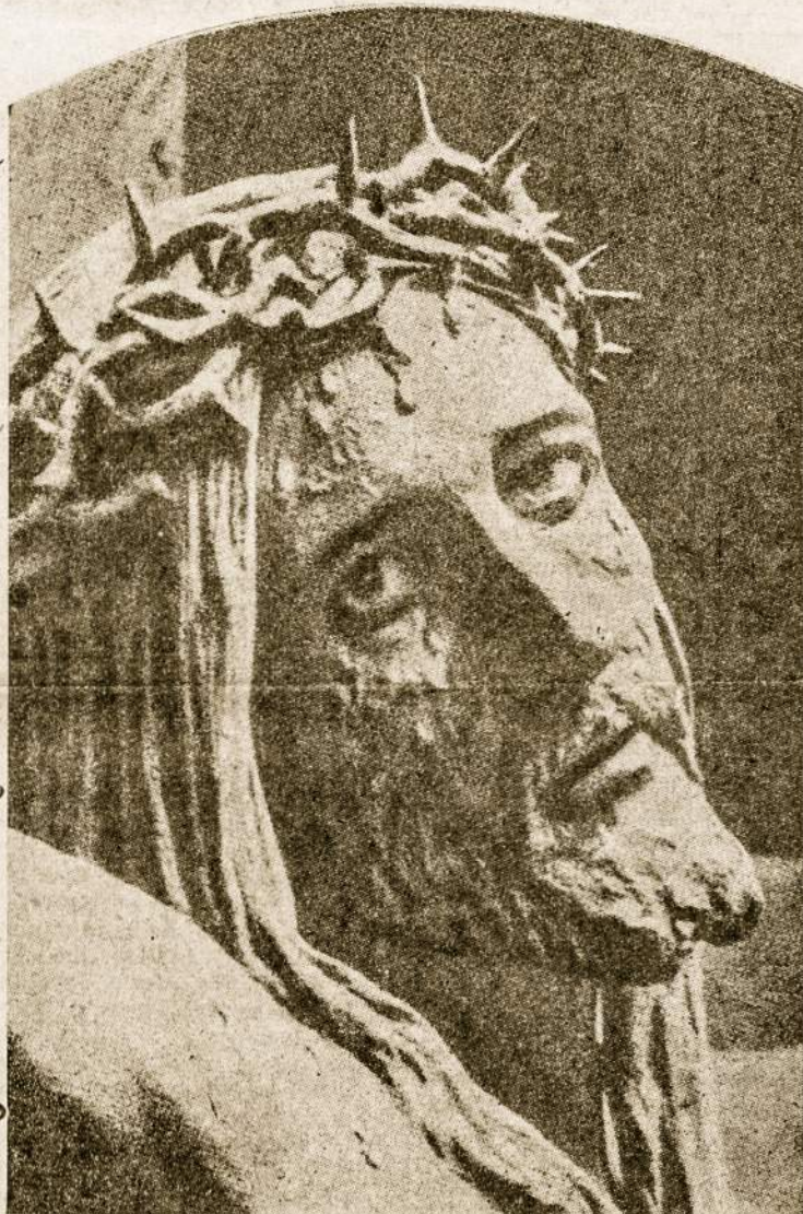
Kristus kenčia persekiojamoje mūsų Tėvynėje, bet meiliai žvelgia į prašantį ir atgaliojantį žmogų.

Jau buvome plačiai kalbėję apie vadinamąją Eisenhowerio doktriną, Artimųjų Rytų politi-