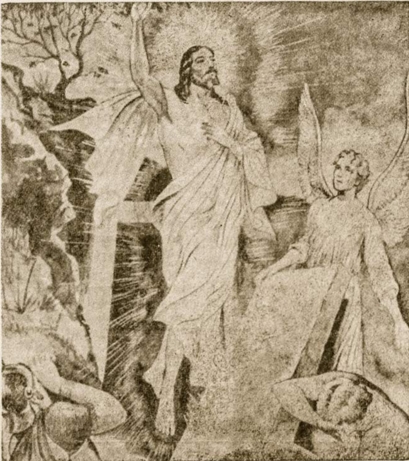
Kėlės Kristus, mirtis krito — Aleliuja, Aleliuja...