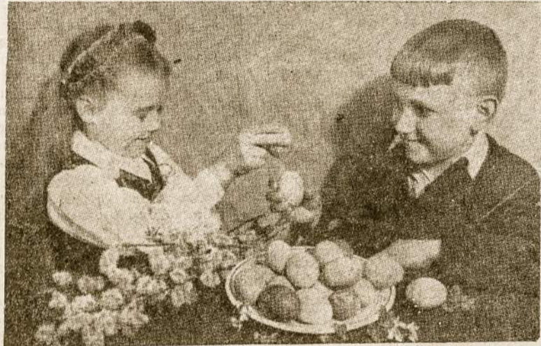
Velykų margučiai — mažųjų džiaugsmas

tojo, kad jo gyvenime nebūtų buvę kryžiaus ir juo didesni šventieji, juo daugiau įvairių kryžių turėjo, nežiūrint, iš kur jie atėjo, ar iš gamtos, ar iš ligos ar iš žmonių. O pagaliau ir pats žmogus yra sau didelis kryžius, nes turi visą laiką kentėti visokias savo silpnybes, kad net didysis Tautų Apaštalas Povilas šaukia: „Kas mane išgelbės iš to kūno vergijos?“ ir gauna atsakymą, kad Dievo malonė.