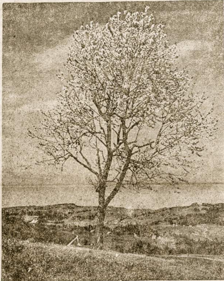
Vilniaus žemėj taip pat žydi Vyšnios pakelėj.