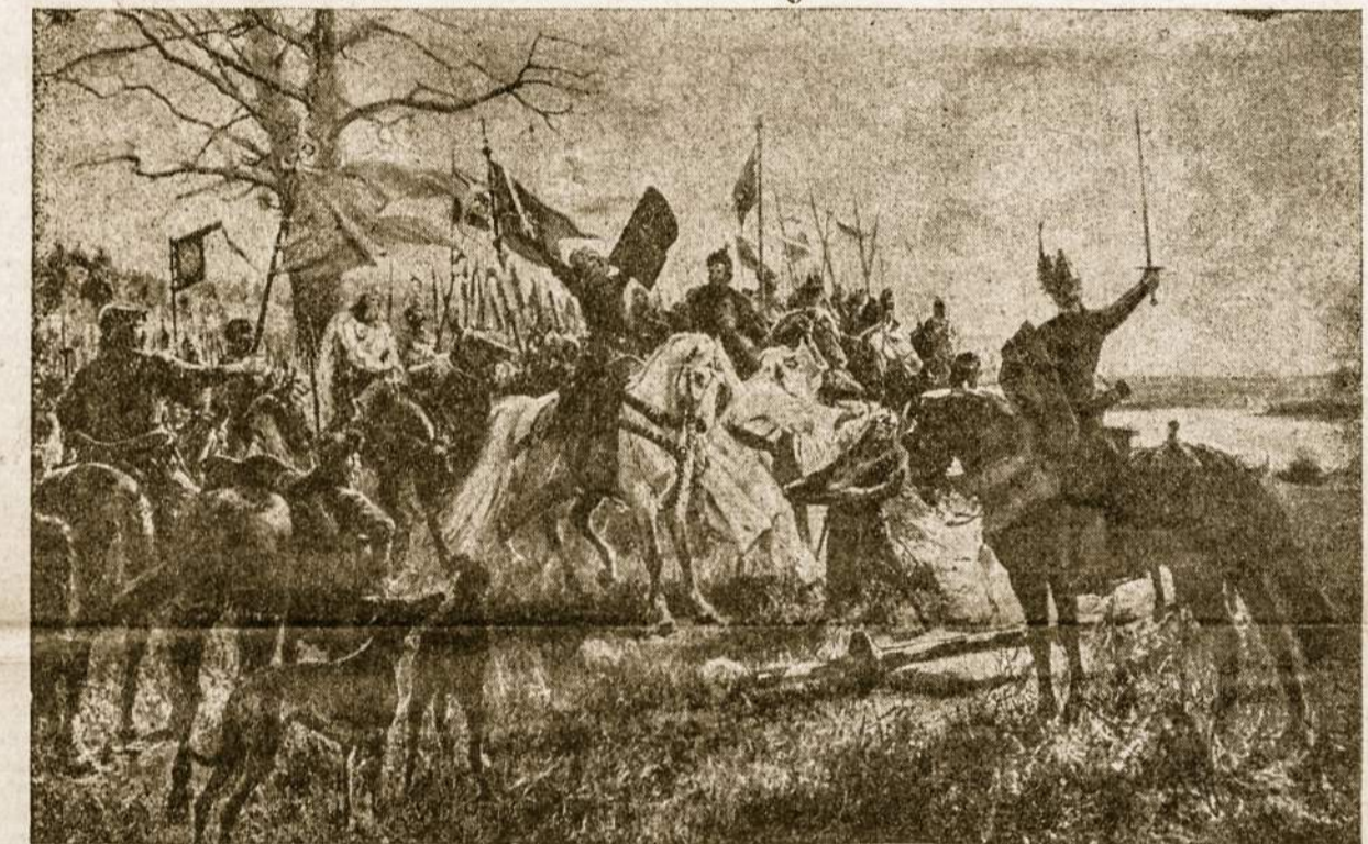
„Nepadėsiu ginklo iki nebus sutriuš kinta Ordino galybė“ — Vytauto priešai prie degančios Kauno pilies

Egipte ir jo įvairių pažadų, „raudonos voras“ savo lipnau voratinklio centrą turi pasirinkęs Sirijoje, pabrėždami Taškento propagandinio universiteto uždavinius Art. Rytuose ir tuo būdu parodydami Artimųjų Rytų komunistinio pavojaus centrą. Visa tai maždaug po metų laikotarpio pasitvirtina: Sirija susilaukė Chruščiovo „saulės“ (prisiminkime į Lietuvą parvežtą „Stalino saulę“). Šis komunistinis Sirijos perversmas buvo