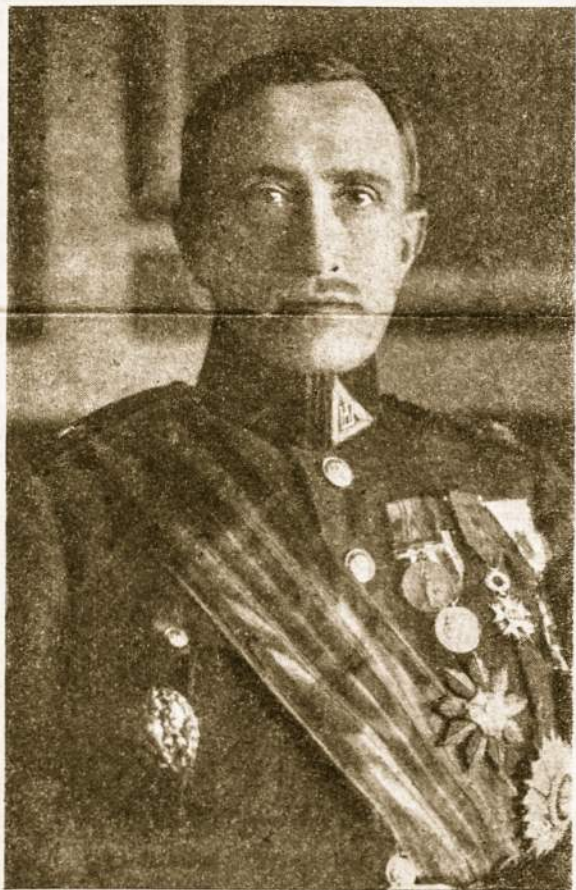
Gen. T. Daukantas — „Laiko“ bendradarbis; jo atsiminimus pradėsiame spausdinti nuo sek. „Laiko“ nr. (Nuotrauka daryta jam būnant Krašto Apsaugos ministru).