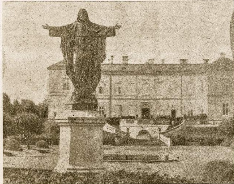
„Atėikite pas mane visli...“ — Kristaus Karaliaus statula Palangoj

vergiją, neapykantą, pavydą, kovas ir riušes, kuriose jau ant žemės jaučiama pragaro tvaikas. Išdidus šių dienų žmogaus protas mėgina viską technikos pažanga sutvarkyti ir Dievą bei religiją, kaip iš viešo, taip ir iš privatus gyvenimo pašalinti. Tačiau tokio gyvenimo klaidų vaizdą mes matome komunistinėje sistemoje; ten žmogus žmogui virto žvėrimi. O visur trūksta tik vieno — Kristaus nešančio visiems ramybę ir taiką. Po Jo valdžia visiems būtų ramu, gera ir sotu gyventi. Tačiau kaip Jis pats yra pasakęs „pirmiausiai turime rūpintis Dievo karalyste ir jos teisybe, o visa kita bus pridėta“. Jei to raginimo vedini tartuoliai, kreipdami savo žvilgsnį į amžinybę, atsisakytų palinkimo didinti turtus ir dalintųsi