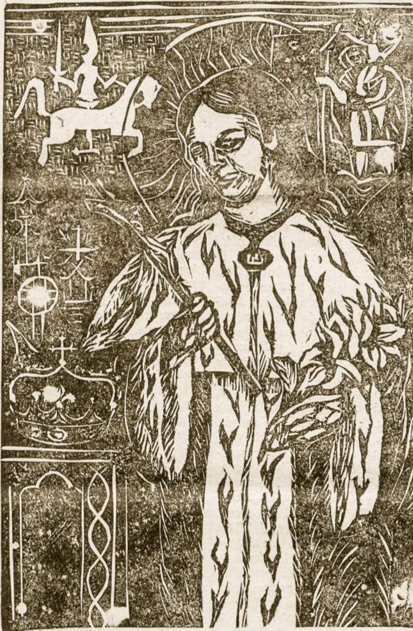
SV. KAZIMIERAS — LIETUVOS GLOBĖJAS (šįmet sueina 500 m. nuo jo gimimo)

Indonezijoje vykstančios revoliucijos negalima palyginti su revoliucijomis lotynų Amerikos kraštuose, kuriose jos neturi tarptautinių komplikacijų nei pavojaus plėstis. Čia gi yra visai kas kita, nes Indonezija nėra žemyno, bet salų valstybė siekiančių keletą tūkstančių ir