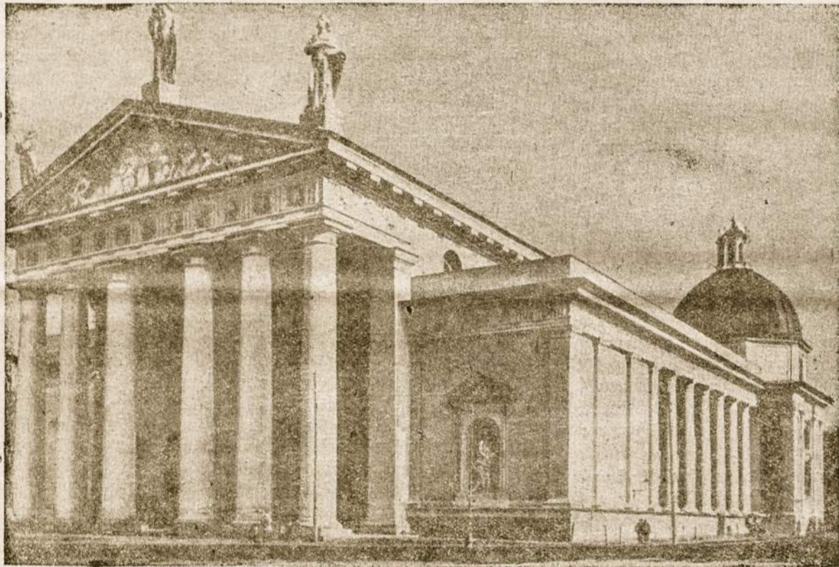
VILNIAUS KATEDRA — LIETUVIŲ SVETOVE.

jo ir atkatalikėjo. Okupuotame Vilniaus krašte katalikų bažnyčia lietuviams buvo persekiojama, bet kadangi jau buvo ir laisvosios Lietuvos lietuviška provincija, tai kai kurie jų argumentai dėl „pagoniškosios“, (suprask, lietuvių), kalbos nubluko, ir dėl to prisėjo ieškoti kokių nors priemonių smunkančiai „šventajai“ lenkų kalbai gelbėti. Ir štai „žymus teologas, kun. D-ras Mykolas Sopočko, Vilniaus Universiteto profesorius“ išgalvojo reikalingumą Jėzaus gailestingumo kovojančio prieš Dievo teisingumą ir per kokią tai jo paties įmokytą, nemokančią veik nē skaityti, nē rašyti, Sesele Faustina Kowalską, pradėjo skelbti lenkų ir jų išgalvotų katalikų Bažnyčiai reikalingumą prirengiant pasauli paskutiniam Kristaus atėjimui. Bet kol dar Lenkija buvo laisva, tai jokia būdu neįstengė gauti pritarimo lenkų Episkopato, bei šv. Sosto Atstovo arkvysk. Cortesi, bet kai rusai užėmė Vilnių ir Lietuvai gražino, tai tada buvo leista