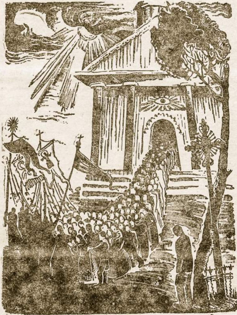
Velykų Priskėlimo rytas Lietuvoje...

Victor Hugo rodydamas į knygą ir į Paryžiaus katedrą sakė: „Tu išrinkai ją (knygą) ir ji nukūdė ją (katedrą, tai yra tavo tikėjimą). Ar ne tiesą? Nenorėkime per daug toleranciją