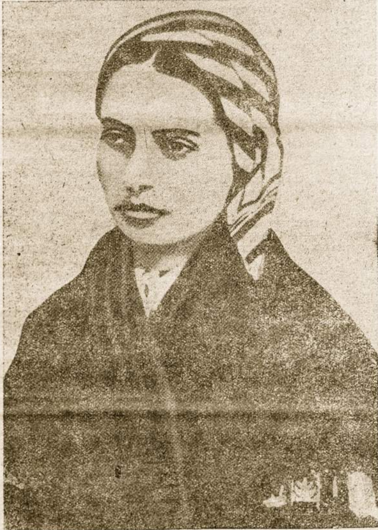
14 metų šv. Bernadetos fotografija, kai apie Nekaltiausiosios pasirodymus ėjo karšti ginčai ir ji buvo įtarinėjama apgaudinėjimu.

nai Liurde veda prie nepaprasto ir karšto pamaldumo mūsų Išganytojui. Gi savo kitame ganytojiškame laiške (1911 bal. 23) taip rašė: „Vienintelė Liurdo šventovės garbė yra ta, kad ten Marija patraukia žmonių minias garbinti Jėzų Kristų Švenčiausiam Sakramente. Ši šventovė, būdama Marijos