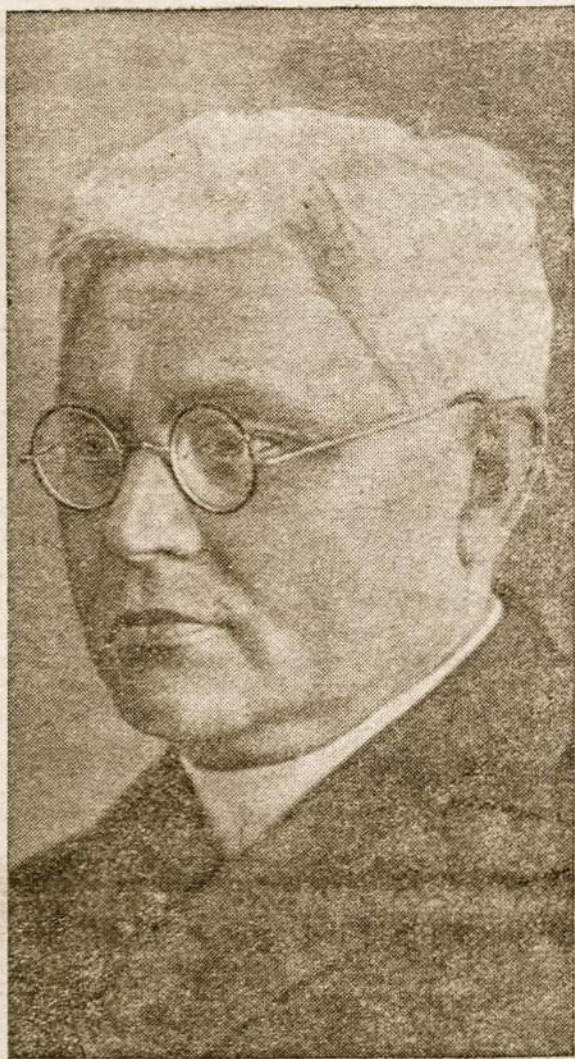
J. Tumas - Vaižgantas, gimęs 1869 m. rugsėjo mėn. 8 d. Malaišiu k., Svedasų par., Rokiškio apskr. Mirė 1933 m. balandžio mėn. 29 d. Kaune.

Maža to. J. Tumas-Vaižgantas ir politiniais klausimais tardavo savo svarų žodi. Taigi, jis buvo visuomenės organizatorius, įvairių draugijų kūrėjas, laikraščių redaktorius, publicistas, rašytojas, literatūros kritikas ir istorikas, u-to pro-