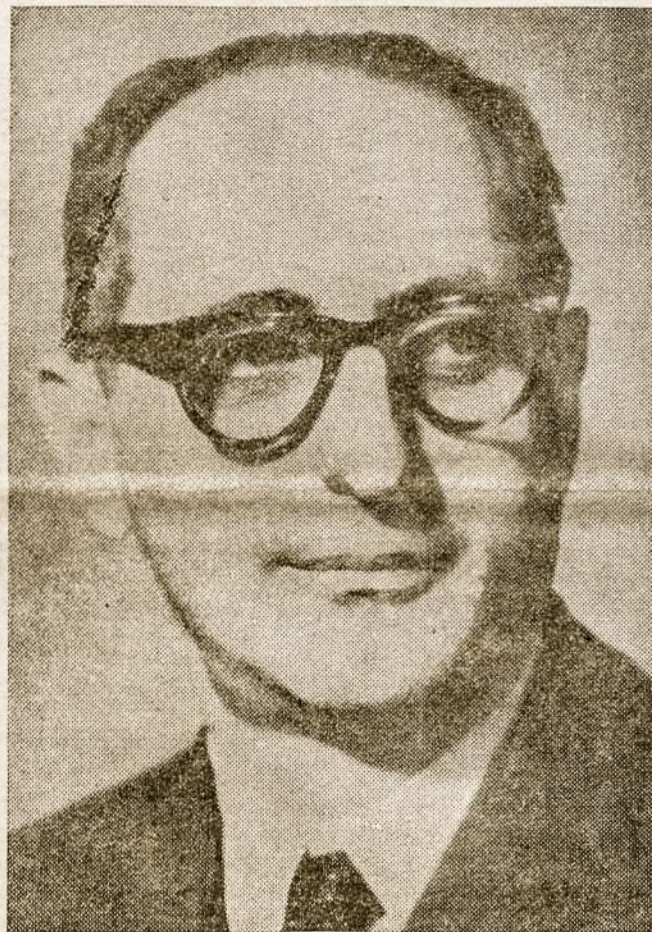
Argentinijos Respublikos Prezidentas dr. Arturo Frondizi gegužės 1-mąją dieną perėmęs Valstybės vairą į savo rankas.

laiku tęsias „be pradžios ir galo“ derybos, kuriomis, būtent, sąlygoms turi susitikti didieji, ir kas skaitytini didžiaisais. Kadangi vakariečiai yra bent trys tikrieji didieji (iš inercijos), tai rusai reikalauja iš savo pusės, kad ir jų būtų trys (iš veržlumo). Atrodytų, kad tuo tarpu bolševikų iniciatyva vyrauja. Bet čia įsiveržia Tito su savo „linija ir svaboda“ (Toks laikraštis eina). Tito spardymasis atsipalaiduoti nuo