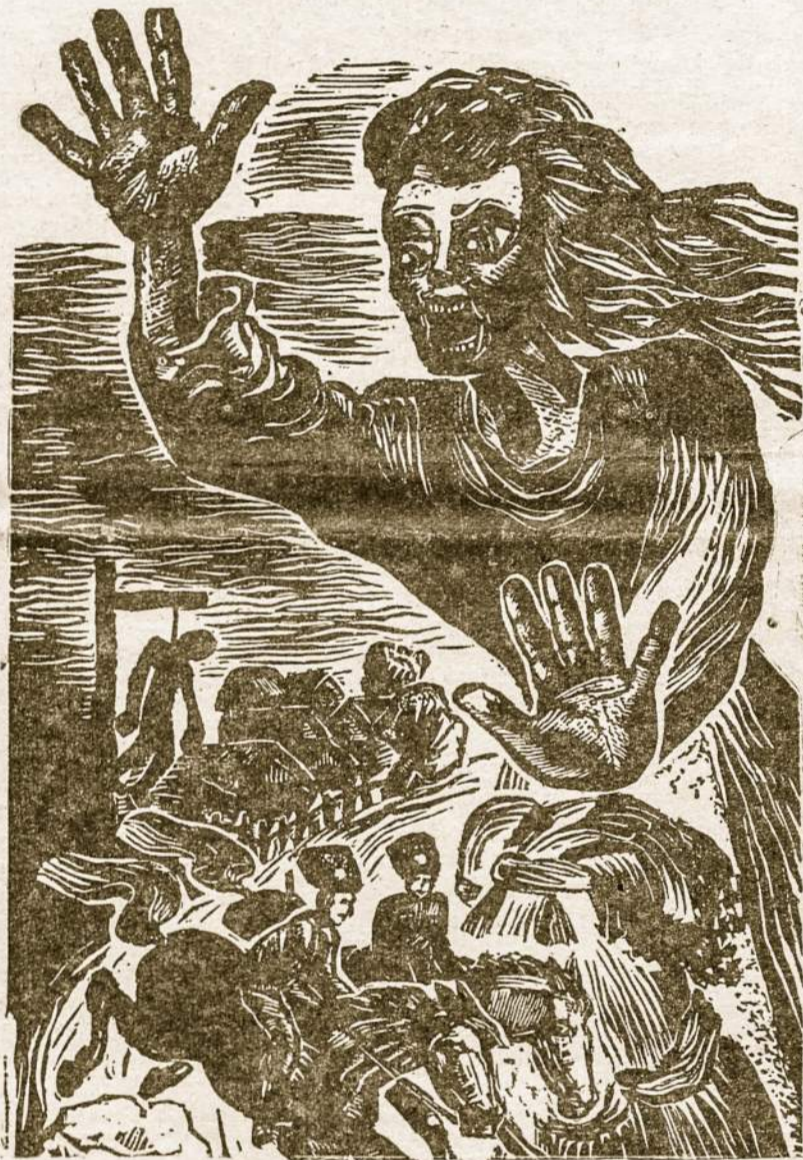
KUR BAIME IR SMURTAS VIESPATAUJA...

loginėmis priemonėmis sustiprinto biurokratija ir valstybės visagalybė. Ryšium su tuo politinėje plotmėje pasireiškę stiprus valdžios sukonzentravimas valstybės aparato naudai, valstybės ir kompartijos funkcijų suliejimas ir vienašališkas centralizmas. Ideologinėje srityje jugoslavų komunistai įžiūri nukrypimą nuo „pagrindinių mokslinių marksistinių-lenininių pažiūrų“, kas liečia valstybės paskirtį, kompartijos sampratą,