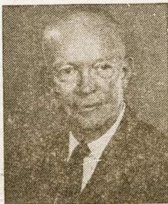
JAV Prezidentas D. Eisenhoweris, kurio visokeriopos taikos pasiūlymus sovietai atmeta

Viršūnių konferencijos ruošta vyksta tiek sunkiai, kad jau imama abejoti, ar ji artimu laiku iš viso galės įvykti. JAV užsienio reikalų ministeris Dullesas birželio 6 d. užs. r. komisijos posėdyje pareiškė, kad jo nuomone viršūnių konferencija šiemet vargu ar dar įvyks. Iki šiol dar nesudarė tikro pagrindą tokiai konferencijai. Tuo tarpu tuo klausimu tariamasi „slaptosios diplomatijos“ metodais.