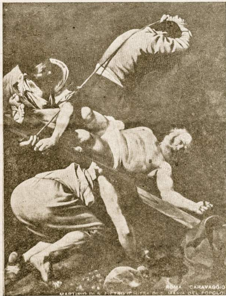
ŠV. PETRO NUKRYŽIAVIMAS. (Caravaggio)

vo pasiryžusios raupsuotiesiems tarnauti iki pačios mirties. Tai išsižadėjimo ir pasišventimo pavyzdys.