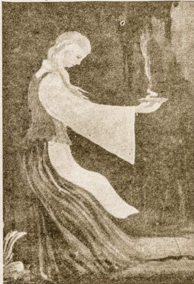
Pasiukojimo, kančios ir meilės ugnis.

nas lankymas grožio salonų, įvairūs plaukų dažymai, veido masažai, įvairių tepalų bei pieštukų vartojimai be abejo padeda. Tačiau ypatingų rezultatų vien šiom dirbtinomis priemonėm niekas neatsiekė. Modernusis moters gyvenimas tačiau yra gerokai prailginęs jos amžių. Statistika rodo, jog moterų amžius per paskutiniuosius 40 metų 17 metų pailgėjęs. Pav. 1910