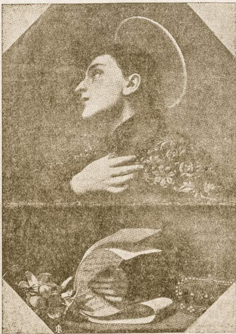
Šv. Kazimieras - (1458.X.3 - 1484.III.4) Carlo Dolci

Švęsdami šmet šią garbingą šventą Kazimiero sukaktį, mes, gyvendami emigravijoje ir esantieji Tėvynėje, turime ne tik atgaivinti savyje, bet ir sustiprinti savo tėvų ir pratėvių pamaldumą ir tikėjimą į šv. Ka-