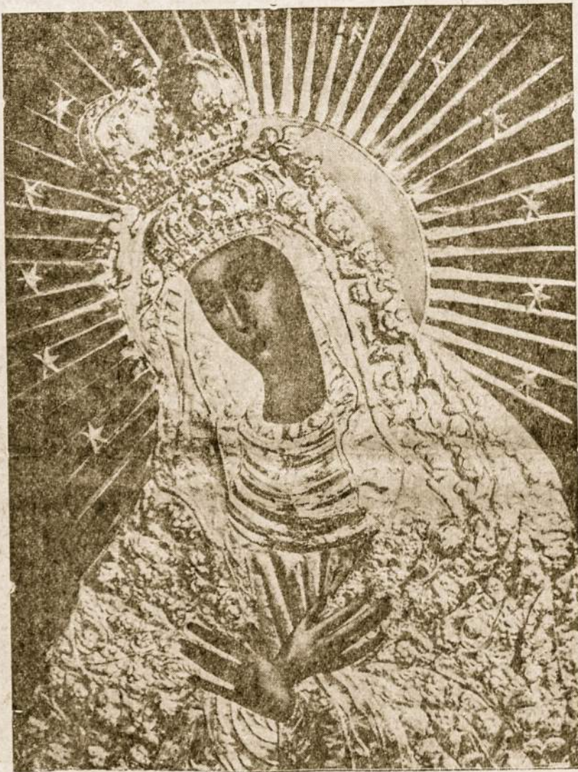
Avellanedos Lietuvių Parapijos Globėja "Aušros Vartų" Švč. Mergelė Marija, kurios metinė šventė lapkričio mėn. 16 d. iškilmingai mūsų bažnyčioje minima.

(E) "Dziennik Zachodni" (Katovice) paduoda suvestinius skaičius apie lenkų perkeldinimą iš Lietuvos, Baltgudijos ir Ukrainos į Lenkiją. Nuo 1955 m. pradžios iki dabar tokių į Lenkiją atvykę 179.000. Vien tik š. m. birželio, liepos ir rugpjūčio mėnesiais persikėlė 21.070.