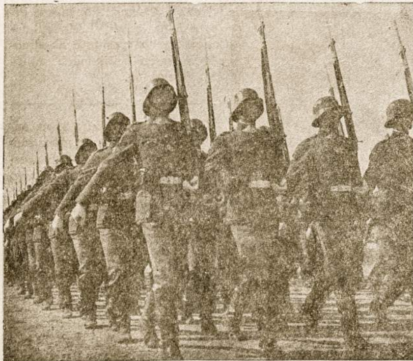
Žengia Nepriklausomos Lietuvos kariai.

geltonplaukė tenka Tau, Vanja". Žinoma, pačias gražiausias išsirinkdavo stovyklų viršininkai. Išnaudoję jas, palikdavo likimo valiai, perleisdami jas žemesniems bendradarbiams, kurie ir vėl toliau perleisdavo. Kiek ten būdavo tragedijų! Štai viena mergaitė, neišlaikiusi smurto ir prievartavimo, šoko į draudžiamą zoną, o sargybinis ją nušovė, nės "bandė pabėgti". Tūkstančiai panašių įvykių, jųros skriaudų ir ašarų ir kraujo.