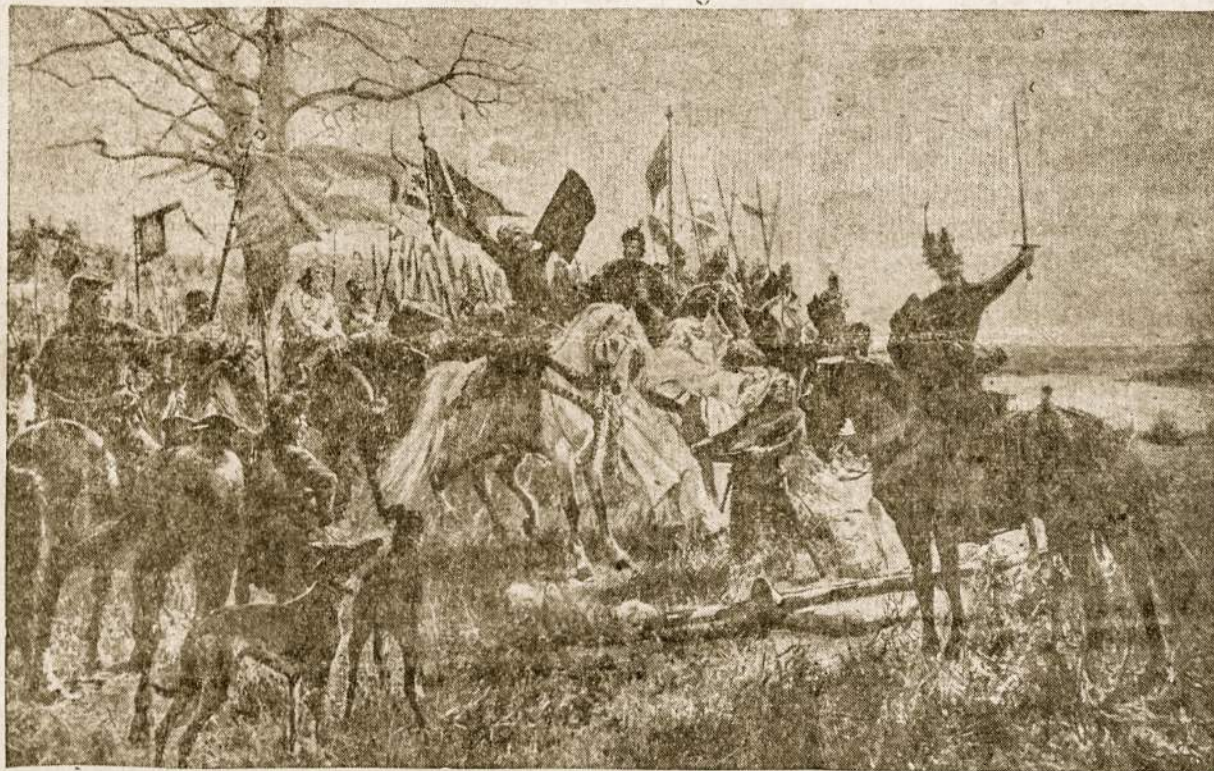
Vytauto Didžiojo kariai prisielia mirtį už laisvę.

čių karinė parama mums laisvės nebūtų iškovojusios. Jei galėjo mūsų tauta 22 metų bėgyje laisvai plėtoti savo dvasines ir medžiagines vertybės, sukurti ir organizuoti valstybę su visomis jos institucijomis, prilygstančioms senoms kultūringoms V. Europos valstybėms, jei lietuvis daugiau kaip po šimto metų vergijos, vėl tapo laisvas žmogus ir galėjo laisvai lenktyniauti su kitomis tautomis dvasinių - materialinių vertybių kūrimą. Tai viso to nuopelnas yra tu, kurie išdriso sunkiose to laikinio karo alpinkybėse paskelbti Lietuvą nepriklausoma valstybe ir tu, kurie tą laisvę su ginklu apgynė. Lie-