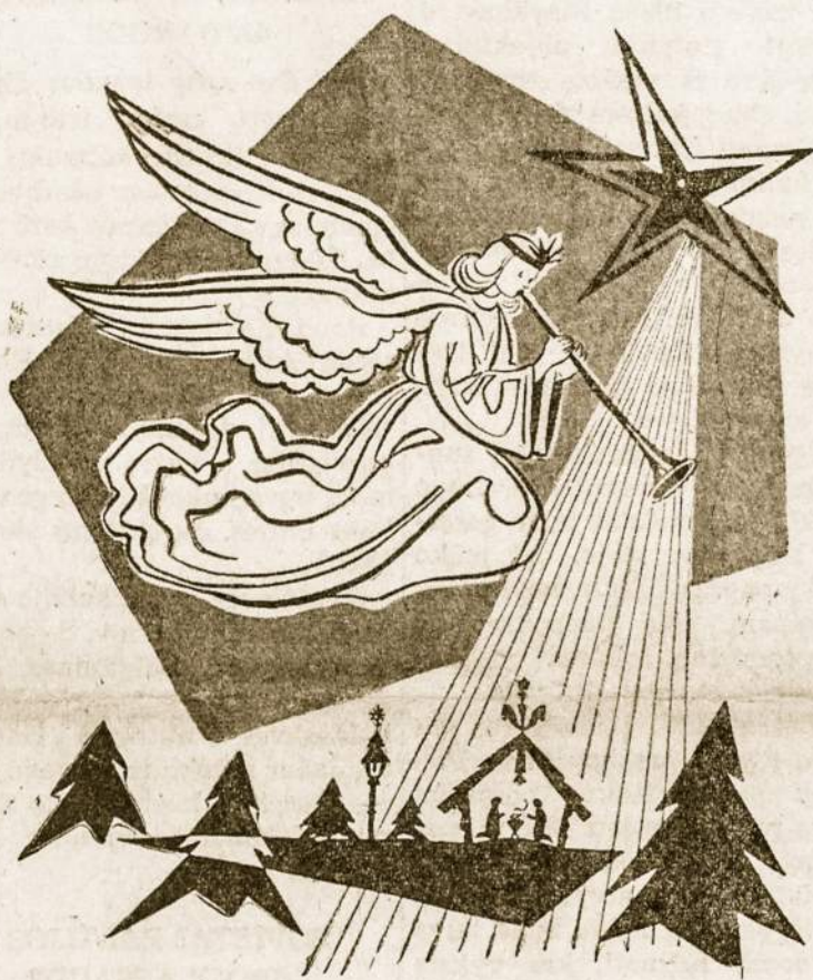
...Ramybė geros valios žmonėms...

Bet dabar, paskutiniuose mėnesiuose pastebimas priešingas procesas: turime Suvienytą Arabų Respubliką, Egipto vie-