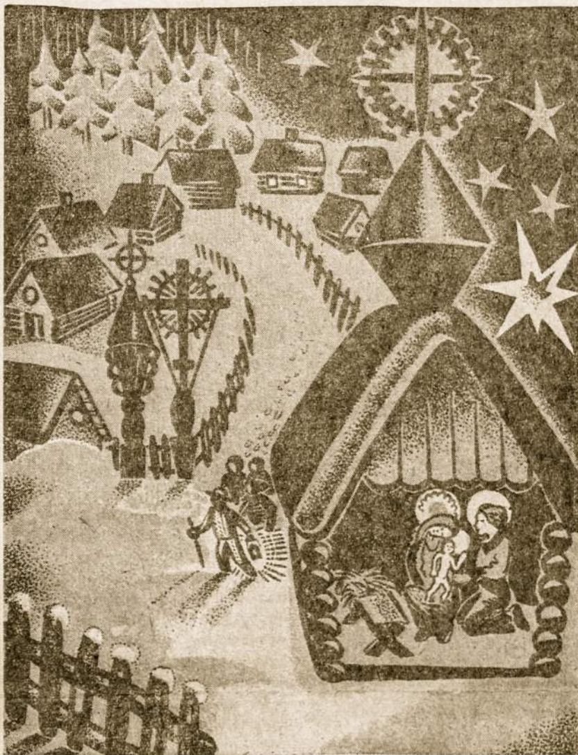
Tyliąją Kūčių naktį ŽVAIGŽDĖ sužibo...

ris, kuri gal labai mus mylės ir norės būti labai mums artima. Bet tas būsimas artimumas visiškai priklauso nuo to, kaip mes elgimės dabar su savo paauglėmis.