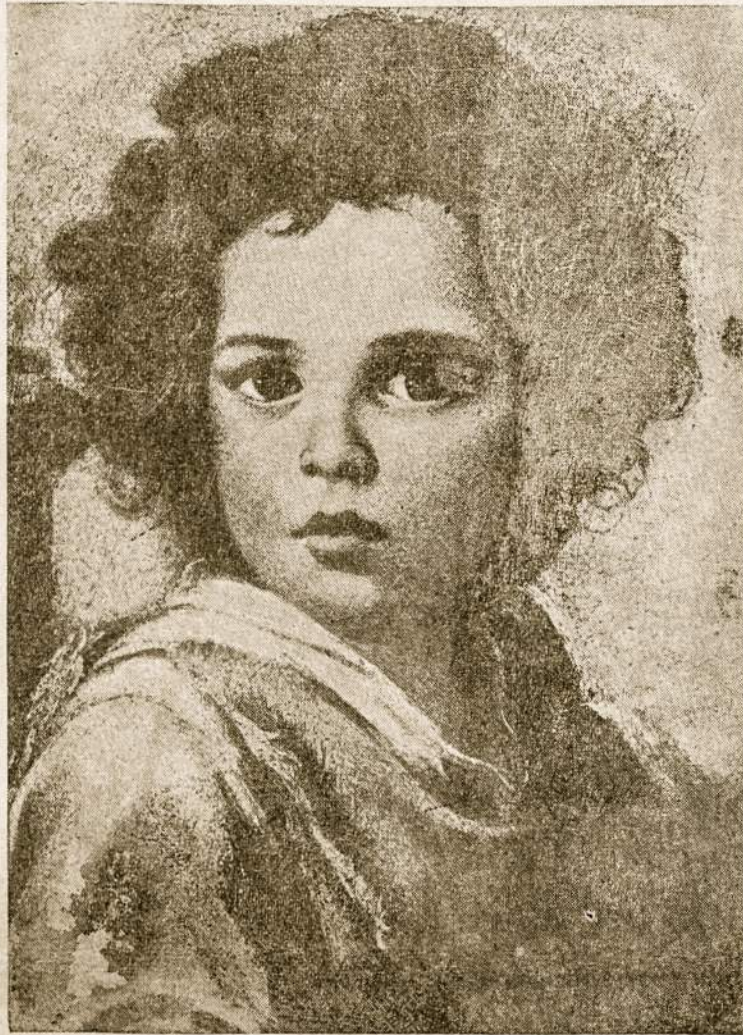
Dieviškasis Ganytojas (Murillo)

Kai karalius Erodas pasiuntė savo budelius nužudyti Kūdikelį Jėzų, Juozapas buvo dangaus pasiuntinio įspėtas. Ir jis ne valandėlės nedelsė. Jis paėmė tą pačią naktį Motiną ir Kū-