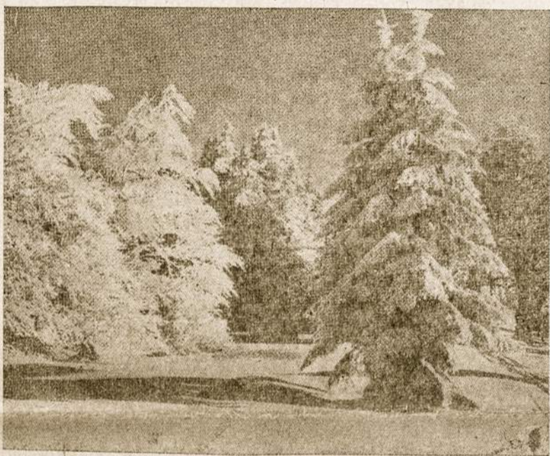
Trapus žiemos grožis baigias Lietuvoj

tik suuodė, kad Vakarų vokiečiai imasi ginkluotis, tuoj esant dar neiškiam pavojui, grasino Berlyno blokada. Nors didelis buvo tuomet Stalino autoritetas, amerikiečių ir sąjungininkų sutartinas veikimas nugalėjo visas kliūtis, ir iš blokados šnipšt išėjo. Vokiečiai gavo teisę ginkluotis... Griebtasi stiprinti Kruščiovo autoritetą Sovietų viduje, bet visokie titai, lenkijos, vengrijos trugdė. Nikita