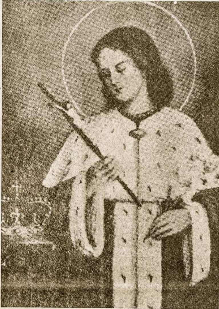
Mūsų Tautos Globėjas šv. Kazimieras

tant kitų kunigų. Per visus metus buvo išdalinta apie 3.800.000 komunijų ir atlaikyta 153.000 šv. Mišių.