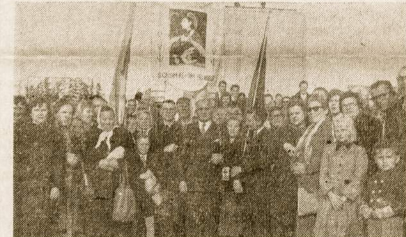
Maldingos kelionės dalyviai - lietuviai su šv. Kazimiero vėliava Lujanė.