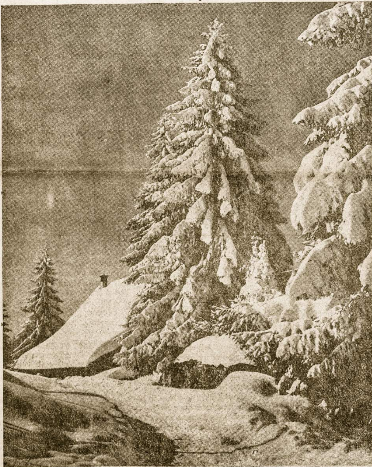
Svetur nėra Lietuvos žiemos grožio

susitarimas dėl nuolaidų yra jau taika su kapitalistais. Neprotinigi tik tiki tiems žodžiams. Stalinas ne sykį sakė, kad visų komunistinių kraštų švenčiausia pareiga padėti "darbo žmonėms" iš kapitalistų jungo išsivaduoti, sukelti ir palaikant revoliucinį judėjimą. Kai mes padovanojam tankus ir lėktuvus, tai jie "laisvai" nubalsavę mums su visų "kraju" sugrižta. O kapitalistai ne labai tanko nuo darbininko balsų teskiria. "Vienas la-