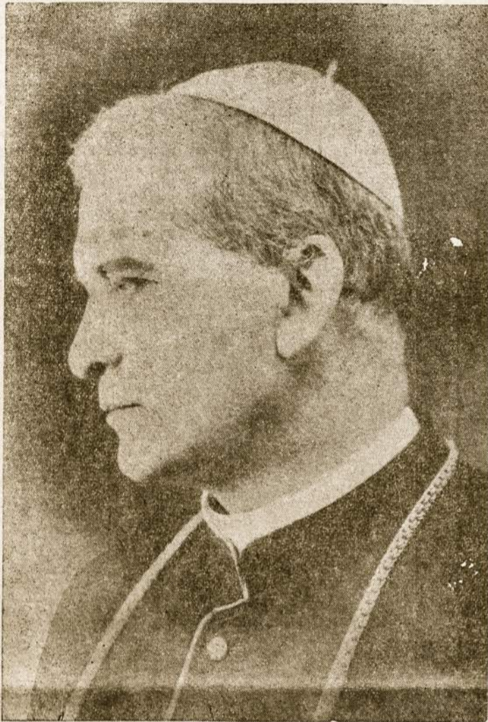
Jurgis Matulaitis 1871 - 1927