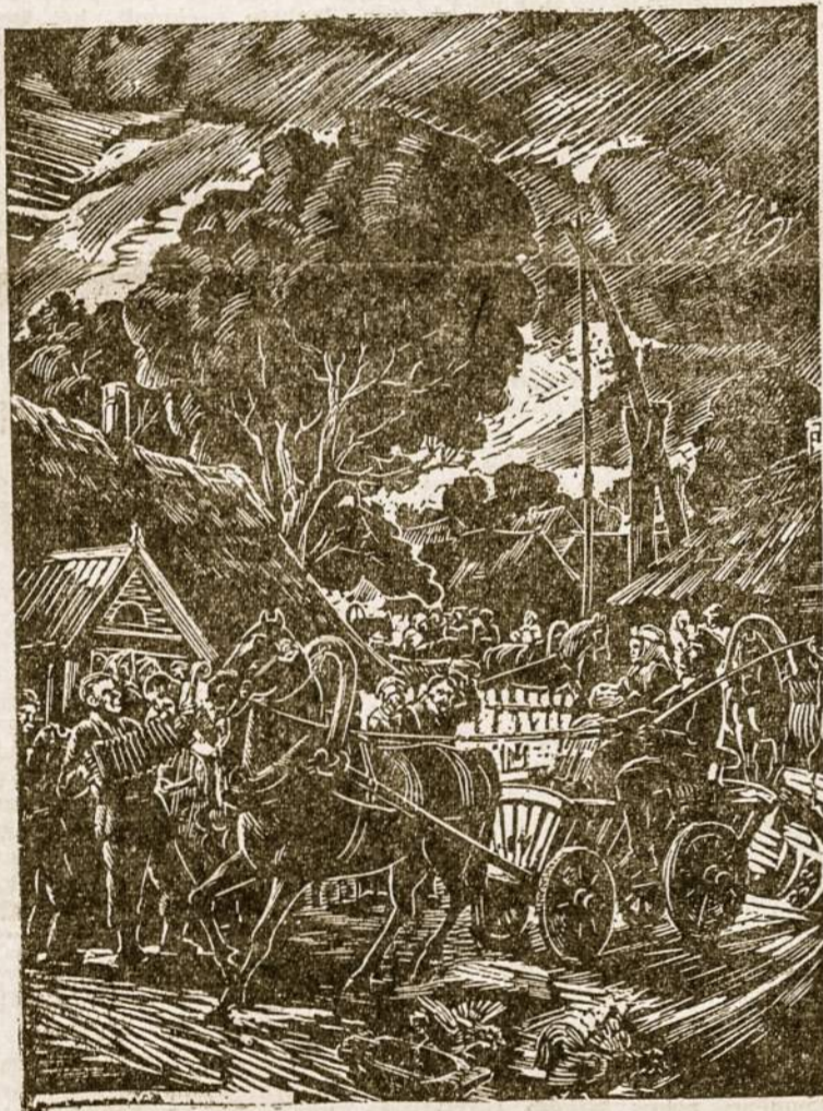
Lietuviškų vestuvių scena

žą, kur nieko draugiško užkasta nerado. Skersai išilgai po Ameriką važinėjo ir ką norėjo apžiūrėjo ir aplankė. Su Rooseveltine, štai, ne vieno žodžio netaręs rimčiausiai nusiteikęs padėjo didžiausią gėlių puokštę prie Roosevelt'o kapo Hyde Park'e ir aplankė jo gimtuosius namus, bibliotekę apžiūrėjo slaptuosius „kupčiaus“ dokumentus. Nesijausdamas revoliucijos tėvu Leninu, nei tironu Stalinu, prieš keletą metų visai pasaulyje negirdėtas, bet išikovojęs viešnagę Amerikon rodėsi „kas buvo nieka, tas bus viskuo“. Pažvelgus į Eisenhower'io veidą matėsi, kaip mandagumo saskaita buvo perkamas suvedžiojimo vaidinys. O nuoširdus, bet slaptas susitarimas nei Rusijoje nei Amerikoje viešumon „ne viską“