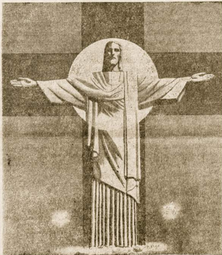
"Man duota visa valdžia danguje ir ant žemės."