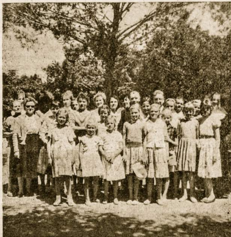
Ar šiemet sulauks Villa del Dique tiek vasarotojų?

Smulkesnes informacijas apie išvykimo dieną ir kitą paskelbime sekančiuose numeriuose.