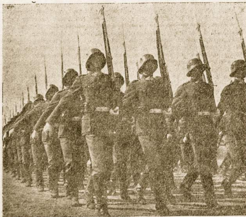
KAIP SUTIKSIME KARIUOMENĖS SVENTĘ?

je ir kitose panašiose bylose paaiškėjo, kad tokių svarbių nusikaltėlių (nenuteistų) esama dar nemažai. Įstaigos uždavinys išaiškinti nusikaltimų medžiagą ir ją perduoti reguliariems teismams atskiruose Vokietijos kraštuose. Kai pagal vokiečių teisę sunkūs nusikaltimai įsiseigė per 20 metų, tai nusikaltimai, įvykdyti, pvz., 1940 metais, įsisenėję jau kitų metų pabaigoje, jei prieš tai neužvedama byla.