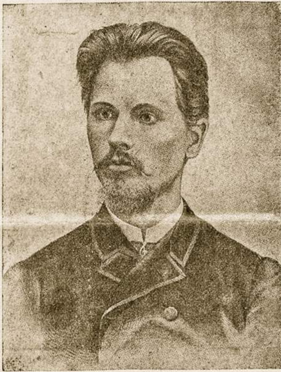
Dr. Vincas Kudirka, miręs prieš 60 metų. (Žiūrėk straipsnį psl. 4)