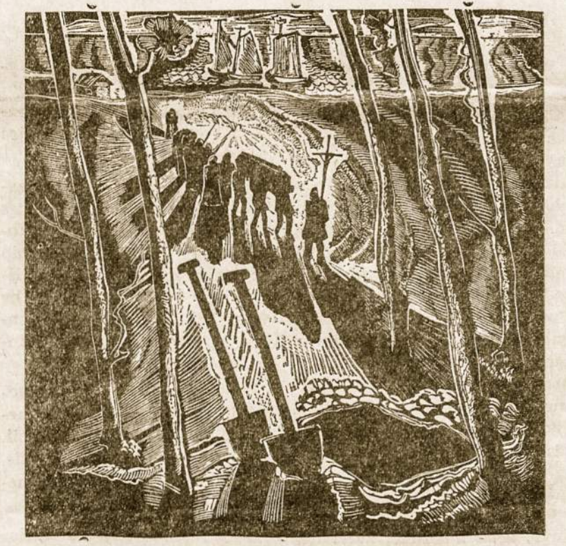
LAPKRIČIO LAIDOTUVIŲ ELEGIJA BAIGIASI ADVENTU

Ką gi laimėjo pasaulis, kai Churchill, Roosevelt ir Truman didžiavosi atominės bombos monopoliju — kokią įsteigė pasaulyje santvarką? paremtą tautų laisvę? teisingumu ir pastovia taika? Sudeginę vieną tiranijos apaštala, kitą užsiaugino dar mandresnį, stambesnį tiranijai diriguoti. O kai šis išsivogęs visų gudrysių paslaptis, pirmasis paleido sputniką, — tai ai, ai! — kažkas negerai su amerikonių mokslu, technika, ir jau laisvojo pasaulio net gimnazistas burliokui neprilygsta. Ir nebesudainuoja ir nerimsta vadovybės kėdėse išrinktieji, gabiliausieji genijai. Pasitikėjimas vakariečių vadybės talentais laimėti, kad ir šalta karą, laisvę ir pastovios taikos santvarką, iškeičiamas į kurapkos išmintį. Eisenhower'io demokratinės laisvės gerbūvio J. F. Dulles su Sherman Adams surkurtoji stovyla viso pasaulio išsivadavimo vilčiai, nuo Herter'io, amerik. milijonierių ir stambiosios buržuazijos politinės išminties smugij tarp permaišyta, kad pats prezidentas pavirtęs po polietiškos viršinkėlių šokinimais prašo tautą būti ramiai, mandagiai ir sveitingai įmantriausiam pakasynų krankliui lankantis, kad nelšrodytų, jog piliečiai jau nebeįsitiki savo vyriausybės protingumu. Nustatė piliečiams elgseną, ką jie turi daryti ir ko nedaryti nesamonių ir prieštaravimų Nikitos kisieliuje.