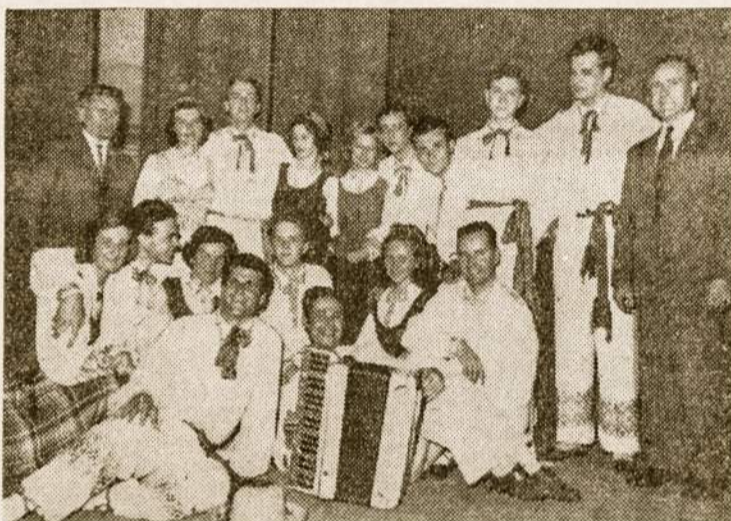
Dabartinė tautinių šokių grupė