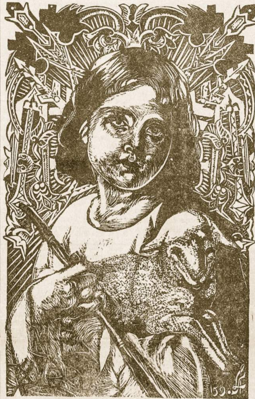
Gerasis Ganytojas gimęs iš Mergelės Marijos.

12 mėnesių, po kurių jaunavedžiai galėjo gyventi jau kartu. Iš evangelijos matome, kad laike sužadėtuvių Marija tapo dangaus angelo aplankyta ir pradėjo Kristų iš šv. Dvasios.