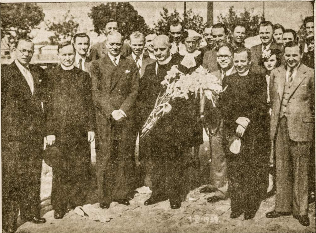
ARGENTINOS MISIJONIERIAUS TĖV. J. JAKAIČIO SUTIKTUVĖS