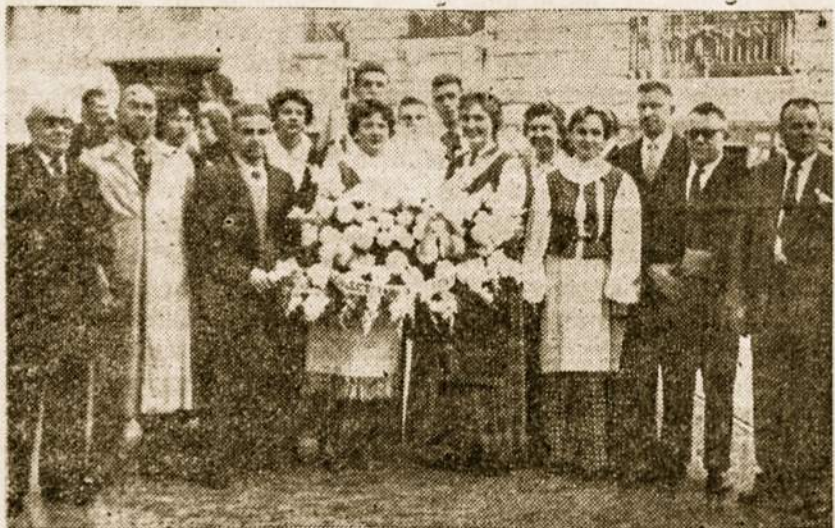
Rosario lietuviai gegužės 25-tą švenčiant