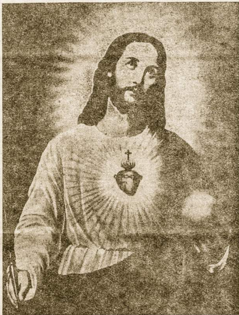
Šv. Jėzaus Širdis — gerumo ir meilės šaltinis

Toji Jėzaus Širdis pradėjo plakti kartu su Nekalčiausios Motinos Marijos Širdimi ir nenustojo plakusi iki pat jos perverimo ant kryžiaus. Betliejaus tvirtelyje toji širdis pajuto pirmą kartą žmonių širdžių šaltumą, bet ji atėjo tam, kad atneštų žmonėms šilumą ir gyvenimą. Jėzus tapo silpnu kūdikiu, kad mes taptume tvirtais per jo malonę. Jis perėjo Palestinos žemės darydamas gerą, kad žmonės įtikėtų į jo meilę.