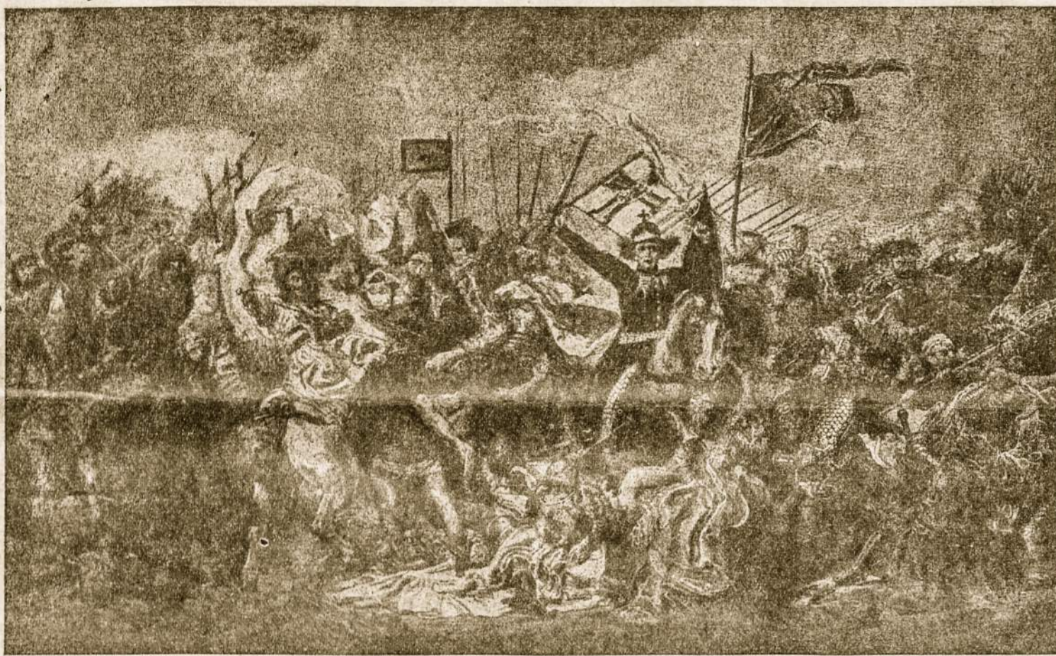
ŽALGIRO MŪŠIO VAIZDAS: VIDURYJE MATOSI VYTAUTAS DIDYSIS, KURIS SUTRIUSKINO VOKIEČIŲ ORDENO GALYBĘ 1410 M.

Minėdami tų didžiųjų įvykių sukaktį, su kartumu turime pastebėti, kad Lietuva, kuri kadaise būdama nors ir nedidelė, bet sugebėjo pajungti po savo globa didžiulius Rusijos plotus,