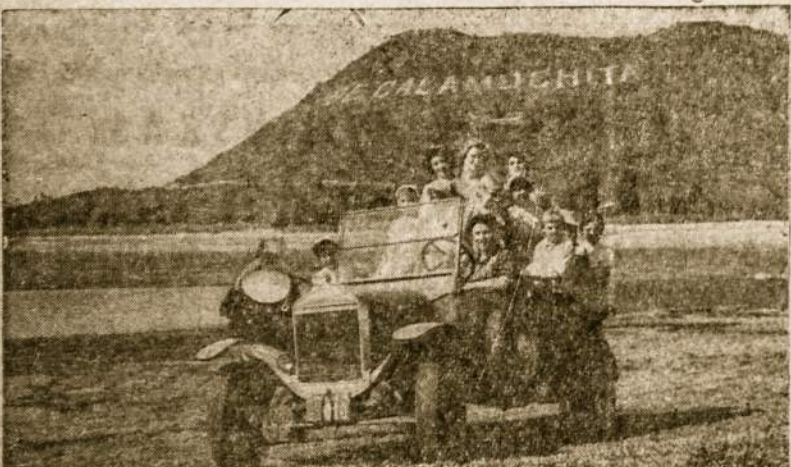
Jaunime, ir šiemet tavęs laukia Villa del Dique!

Temperley šeštadienio Mokykla sausio 7 d. 19 val. (šeštadienį) Pono Žekio namuose rengia Kalėdų Eglutę, į kurią kviečia atsilankyti visus temperliečius ir svečius iš kitų apylinkių. Programoje įvairūs numeriai.