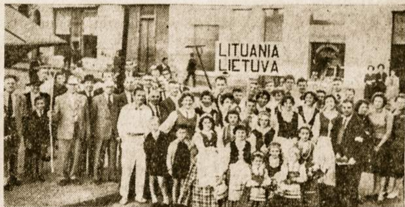
Rosario lietuviai Miesto valdybos surengtoje Užsieniečių Dienoje ("Día del Inmigrante"). Čia matome lietuvių jaunimą su tautiniais drabužiais ir Rosario lietuvius. ("Día del Inmigrante" buvo spalio 8 d.)