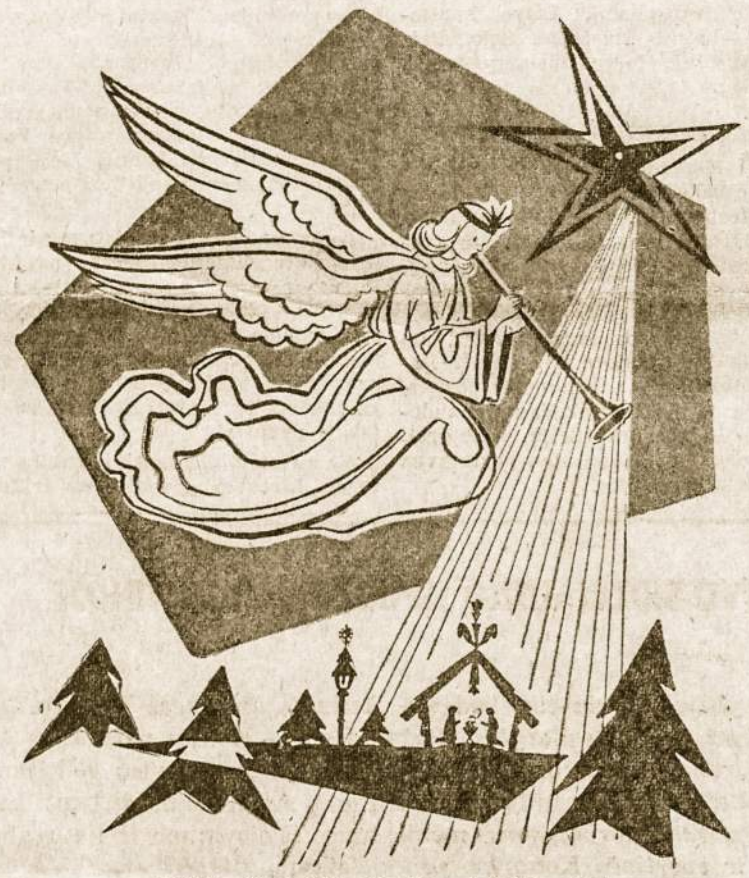
Kalėdų žvaigždė tešviečia virš Tėvynės!

Visa tai kyla dėlto, kad daugelis nepažino tikrojo Taikos Karaliaus, jo nepripažino, bet priešingai jį išvarė iš savų šir-