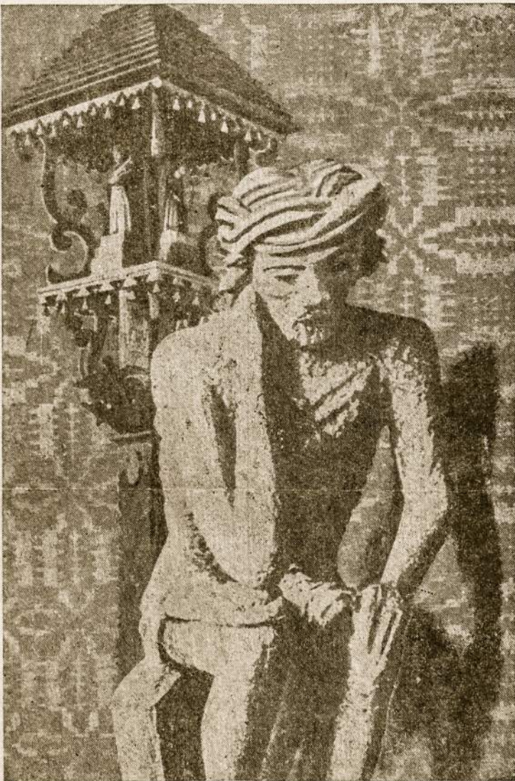
Rūpintojėlis saugo Lietuvos laukus

Velionis ilgus metus kapelionavo Linkuvos gimnazijoje; vėliau buvo pakeltas į kanauninkus ir paskirtas Biržų klebonu ir dekanu. Pastaruoju metu buvo Panevėžio Šv. Petro ir Povilo parapijos klebonas ir kapitulės prelatas. Mirtis ištiko netikėtai; velionis jokiomis rimtomis ligomis nesiskundė.