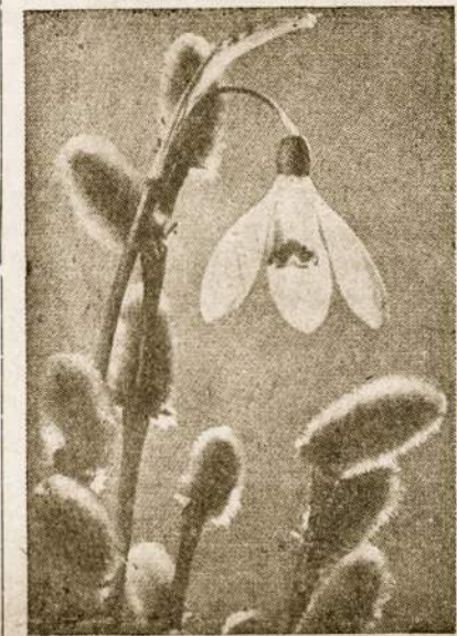
Velykų Prisiminimas suteikia jėgų pernešti vergystės jungą.