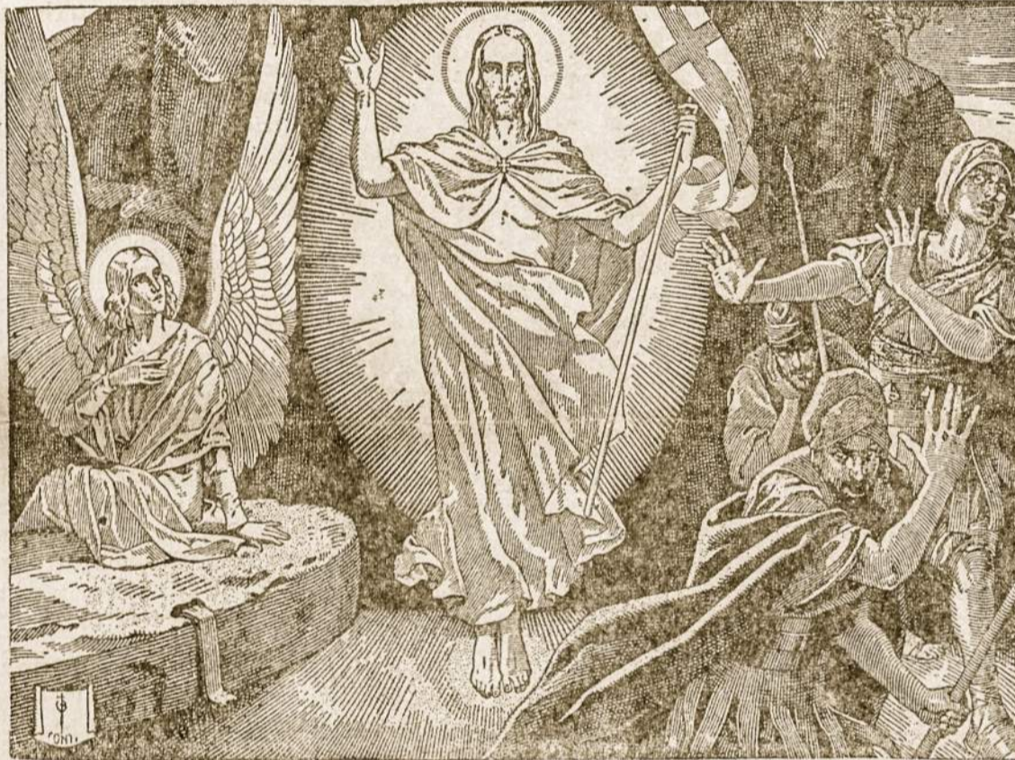
Kristus mirties ir klaidos nugalėtojas, Jis prisikėlė, kaip buvo kalbėjęs

Priėmus krikščionybę užsigėdė pagonybės, žudo karalių ir skaldosi kunigaikštystėmis.