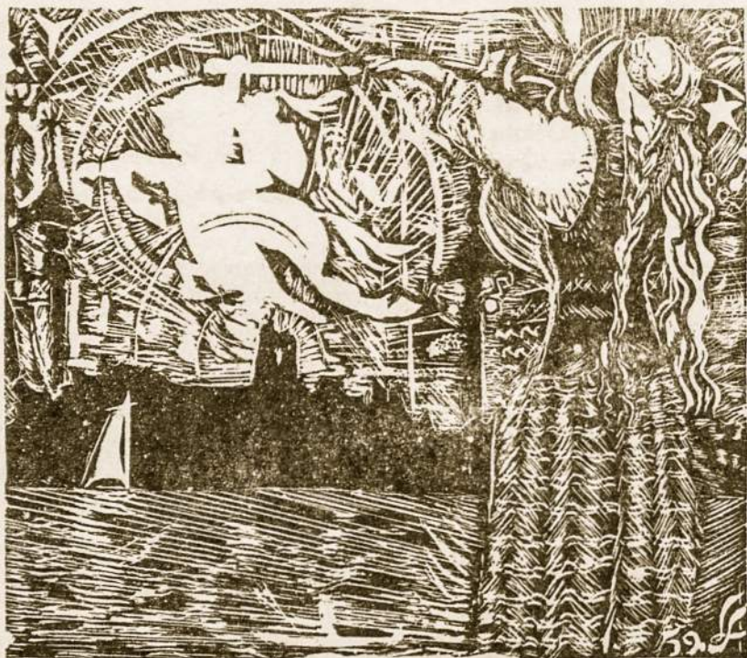
Kada susilauks Lietuva Priskėlimo? (Raiž. kun. A. Lubicko)

Nusavinęs veik visus J.A.V. kompanijų investuotus turtus — nuosavybes, pradeda įtarinė-