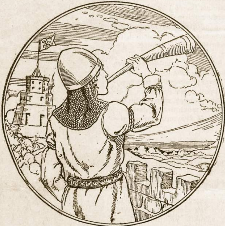
Lietuvos istorinius laikus prisiminus

Gelbėdamasis Mindaugas turėjo taikintis su pavojingiausiu savo priešu — kalavijuočiais. Šie iš savo pusės kėlė sąlygą — priimti katalikų tikėjimą. Mindaugas sutiko ir 1251 m. apsikrikš-