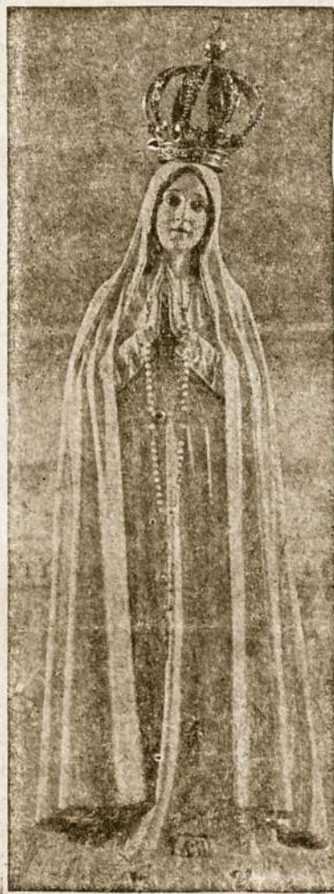
Fatimos Dievo Motina

• Mirė paskutinis Kaizerio Vilhelmo II Kapelionas, sulaukęs 82 m. amžiaus. Jis lydėjo imperatorių jo tremties metais. Vėliau grįžo į Vokietiją ir buvo Rytų Berlyno luteronų katedros dvasiškiu.