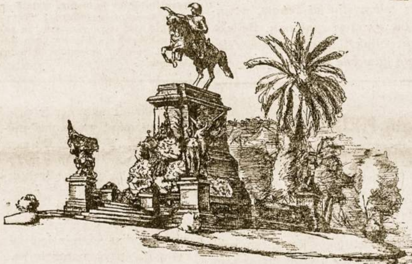
San Martín paminklas Buenos Aires mieste

Argentinoje didinama arbatos produkcija. Misiones zonoje ruošiamasi pastatyti 40 naujų arbatų džiovinimo mašinų. Jomis bus galima aprūpinti visą arbatos produkcijos zoną, kuri viršija 30.000 hektarų. To pasėkoje, per metus bus galima paruošti 15 milijonų kilų sausos arbatos žolių. Turint mintyje labai aukštą šio krašto arbatos kokybę, yra numatyta stiprūs kontraktai su eksporto organizacijomis.