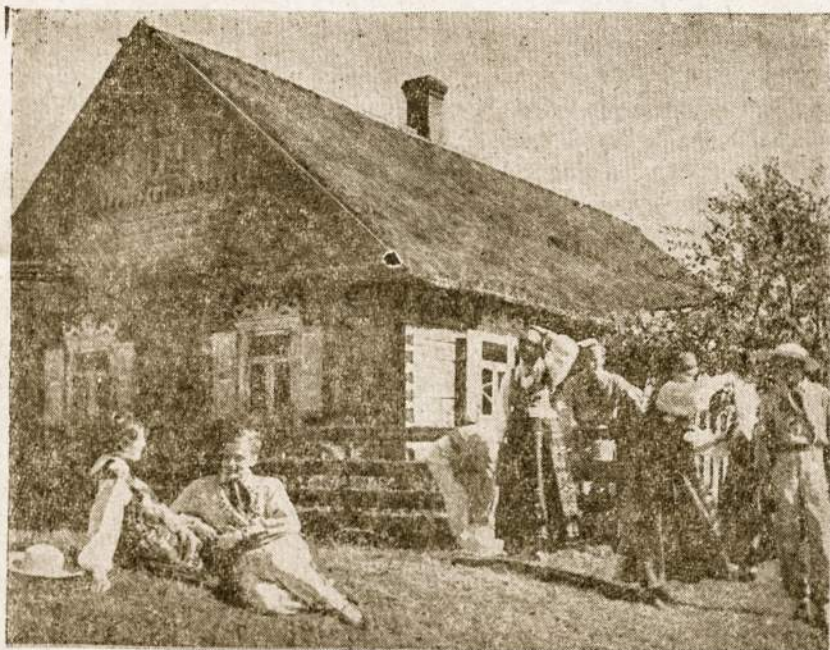
Lietuviškas jaunimas savo tėvų papročių sargyboje: margų lietuviškų rūbų ir lietuviškų dainų bei šokių išlaikyme.

priverstas pareikšti gilų apgailėstąvimą dėl šio žingsnio, kuris — esu tikras — sukels skaudų išpūdį tiek lietuvių tautoje, tiek pas visus tuos, kurie dar pasitiki tarptautinės bendruomenės solidarumu Sovietų Są-