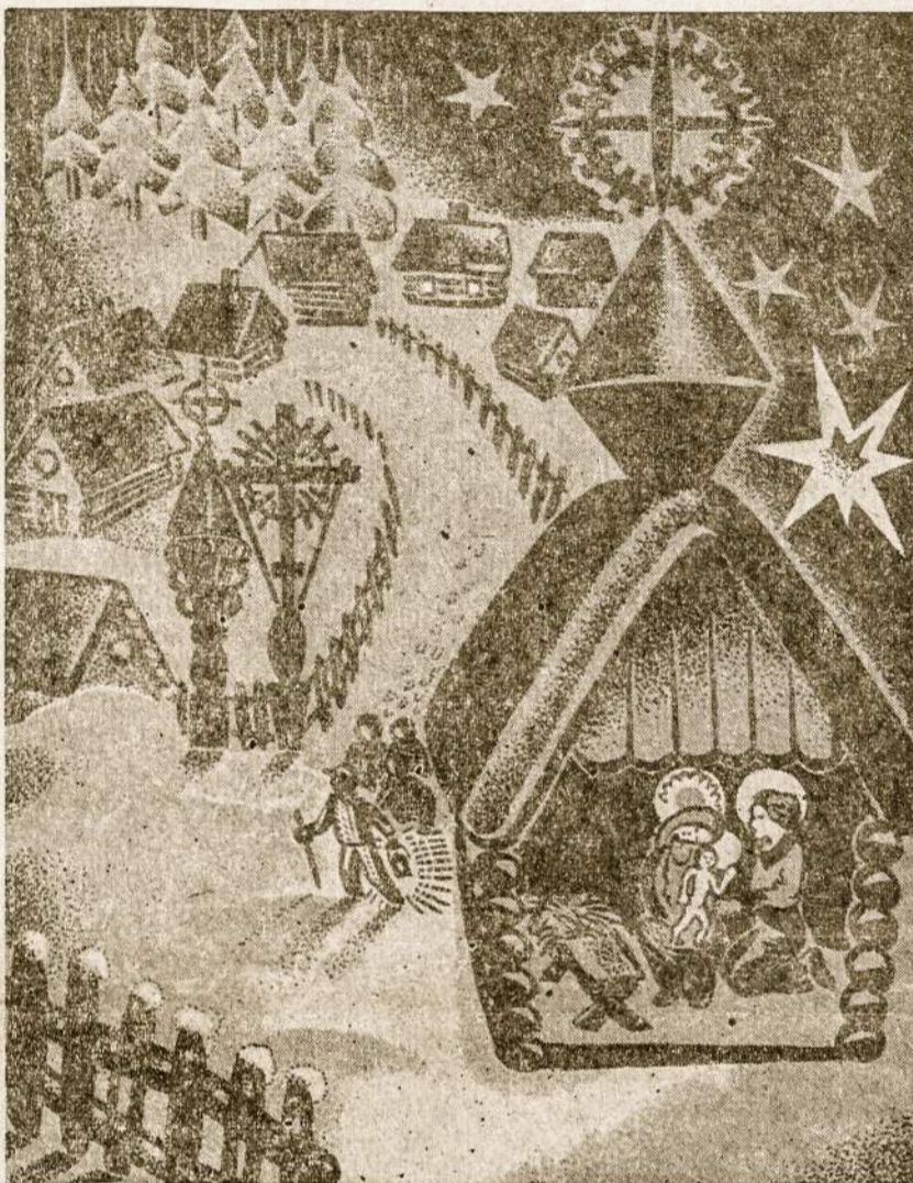
Kalėdų nakties ramybė tenužengia į mūsų širdis